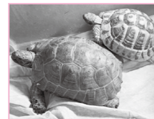
カメのヤン坊&まあ坊