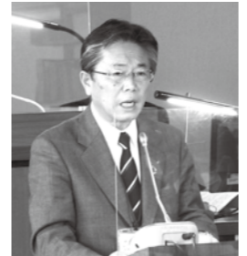
編成方針を述べる木賊町長

重点事業として「チャレンジ元気プロジェクト」を掲げ、今年完成予定の健康福祉センター建設事業をはじめ、成田地区遊水地事業、駅東第1土地区画整理事業などの継続事業のほか、新規事業では人口減少対策として、子どもへの支援として給食費の一部助成、まちづくりの指針でもある「牧場の朝のまちづくり」を進めるための各種事業を展開していきます。