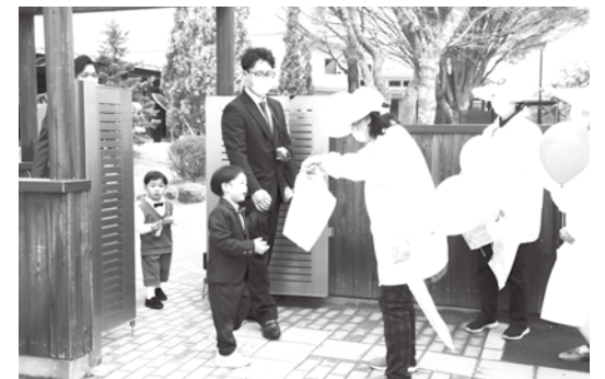
新入園児と保護者に風船とリーフレットを配布した交通安全ミニテント村(認定こども園ぶどうの木)