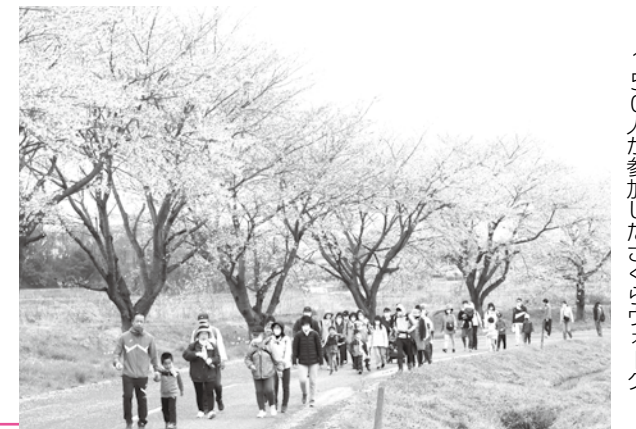
150人が参加したさくらウォーク

今回は、ふれあいの森公園でかがみいスポーツクラブのHIPHOPダンス&ブレイクダンスステージなどのイベントも行われ、参加者が楽しいひと時を過ごしていました。