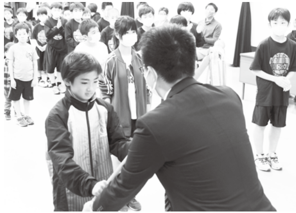
大内本部長から団旗を受ける団員