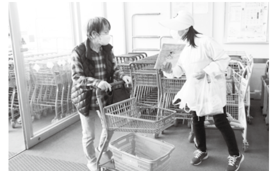
交通安全についてのチラシと啓発グッズを買い物客に配布(イオンスーパーセンター鏡石店)

このほか、岡ノ内幼稚園ではミニ信号機を使った交通安全教室が行われ、母の会の役員らが園児に優しく語りかけながら、横断歩道の渡り方を指導していました。