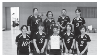
み・マーブルの皆さん