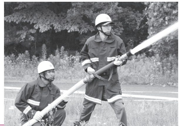
放水時の連携を確認する団員たち

7月9日(日)、鏡石町消防団の中継送水訓練が鏡石町南部工業団地内で行われました。訓練には、全8分団の約60人が迅速で的確な連携を実践し、火災が発生した際の対応の強化を図りました。 訓練は、事前に詳細を知らされないブラインド形式で実施され、団員は同本部からの無線指示に従って水利を確保し、ホースや車両をつないで中継するなど、実火災を想定した訓練に取り組んでいました。