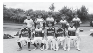
大池クラブの皆さん