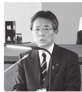
編成方針を述べる木賊町長

重点事業として掲げている「チャレンジ元気プロジェクト」より、駅東第1土地区画整理事業や、令和5年度においてトラックの改修工事が竣工となった鳥見山陸上競技場のメインスタンドや管理事務所の改修事業、