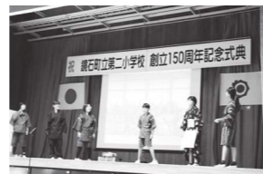
まきばっ子発表会