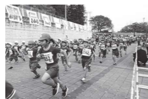
鏡石駅伝・ロードレース大会 (校内持久走記録会)