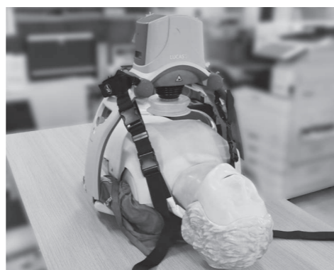
自動式心臓マッサージ器（装着イメージ）