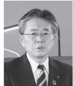
編成方針を述べる木賊町長

令和8年度各会計当初予算は、3月6日(金)から17日(火)まで開催された3月町議会定例会で可決され、成立しました。一般会計当初予算は64億6千万円で、前年度比7千万円、1.1%の減となりました。今月号では、一般会計を中心にご紹介します。