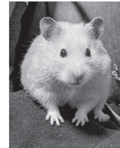
鈴木軍ぶうちゃん