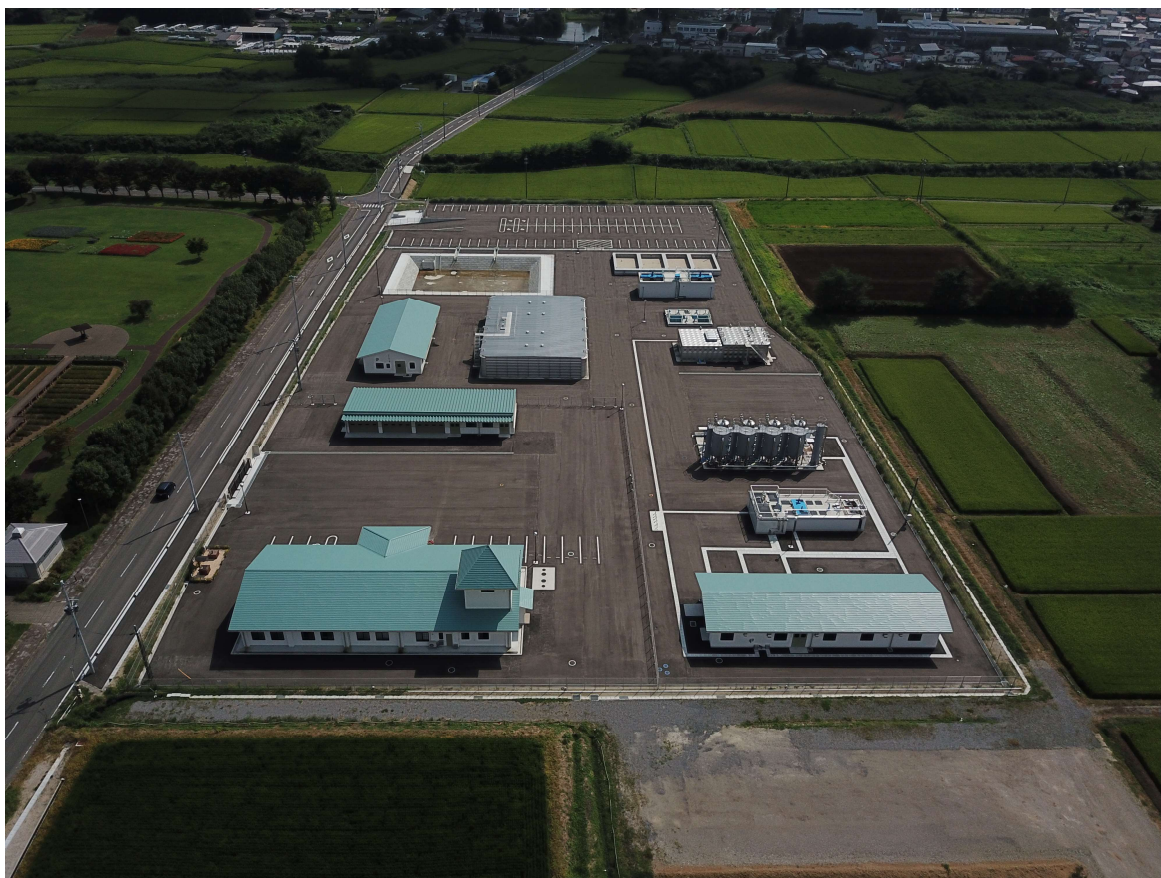
鏡石浄水場 令和4年9月30日完成

水質検査は、水道水が水質基準に適合し、安全であることを保障するために不可欠であり、水質管理を行う基本となるもので水道事業者に義務付けされているものです。その水質検査の適正化を確保するために、水質検査項目等を定めたものが水質検査計画書です。