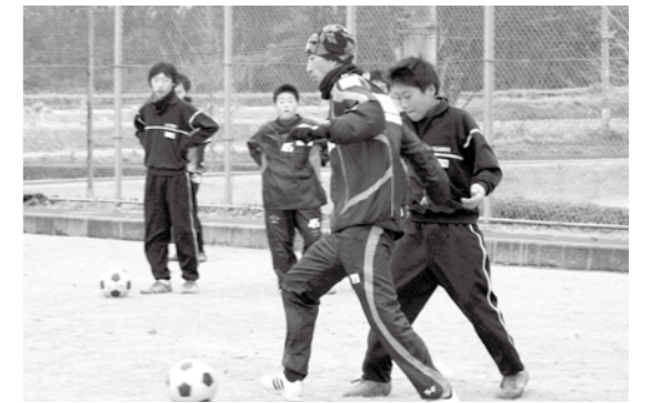
▲プロの教えを身をもって体験する中学生

当日は町内の小中学生を中心に約60名の子ども達が参加し、講師の大宮アルディージャ所属コーチの2人の基礎的な指導やゲームを通じたコーチングなどを子ども達は真剣に指導を受けていました。