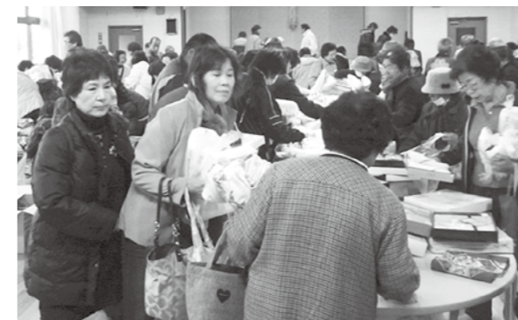
▲多くの人で賑わったバザー会場

当日は、町民の方々からご協力いただいた品物の他、生きがいと創造事業「趣味の教室」の各クラブ【陶芸・手工芸・木工】やライジング・サン(共生かがみ)の手作り作品などが販売されました。