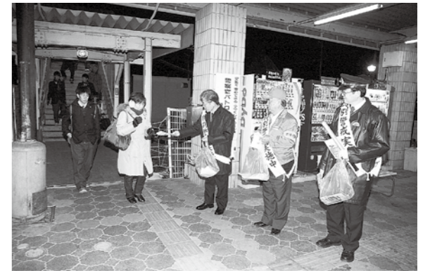
▲鏡石駅で啓発活動をする参加者

11月末日現在の町内の犯罪発生件数及び交通事故発生件数は、昨年対比で大幅に減少しています。