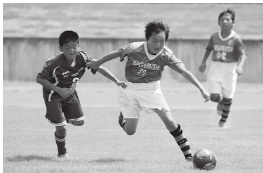
▲鏡石フットボールクラブ少年団

牧場の朝少年サッカー交流大会 ◎8月17日(土)・18日(日) 鳥見山陸上競技場ほか