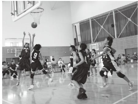
▲ボールに向かってジャンプ

子ども会对抗親善球技大会 ◎7月28日(日) 鳥見山体育館・一小体育館 男子フットサル優勝 旭町 女子バスケットボール優勝 仁井田