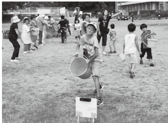
▲地域住民によるバケツリレー

8月25日(日)、町第二小学校グラウンドで町消防団模擬火災訓練が行われ、団員や関係者及び地域の住民約120人が参加しました。訓練は、震災により4年ぶりとなる開催で、今回は鏡石二小付近(豊郷区)において火災が発生したことを想定して行われました。