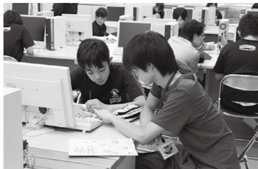
▲もちろん夏休みは勉強もしています