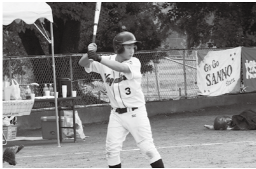
▲鏡石ソフトボールスポーツ少年団

アドベンチャークラブ 尾瀬探勝 ◎7月31日(水)・8月1日(木) 尾瀬国立公園