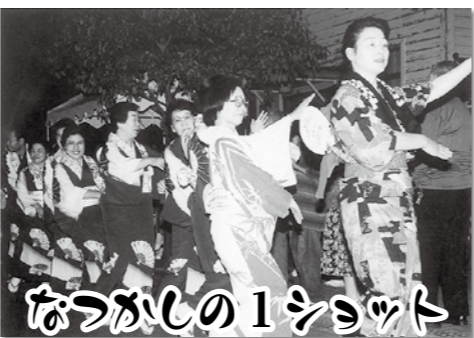
なつかしの1ショット 広報紙 平成9年9月号より「牧場の朝ふるさと踊り」

8月号の私の広報表紙紙デビュリーかがでしたでしょうか。つづやきと表紙の連動企画はまたやりたいですね。広報紙の表紙は毎月考えるのが大変ですが、評判が良かったりすると最高にうれしいものです。 さて、そんな広報紙の表紙をみなさんの笑顔で飾る「みんなの写メールコンテスト」(P8へ掲載)を新たな試みとして実施します。どのような表紙になるかはみなさんの応募にかかっています。応募が無くて広報紙の泣いている写真が表紙なんてことになったら大変なので、たくさんのご応募をお待ちしています!