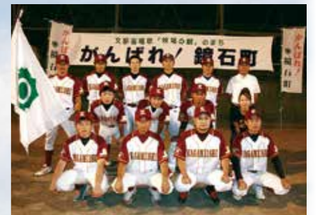
▲ベテランと若手のバランスが取れた鏡石町チーム