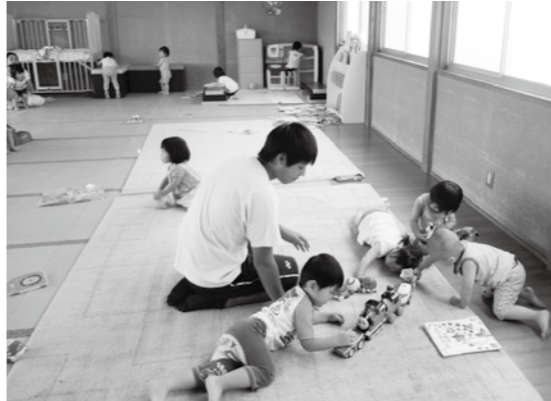
▲保育所分園で園児たちと触れあう高校生

町社会福祉協議会ボランティアセンターは、夏休みに合わせ今年で第10回目となるサマーボランティアスクールを実施しました。この事業には、町内の小・中・高校生90人が参加して、一人暮らしのお年寄りへのお宅訪問や鏡石ホーム、保育所などでボランティア体験をしました。