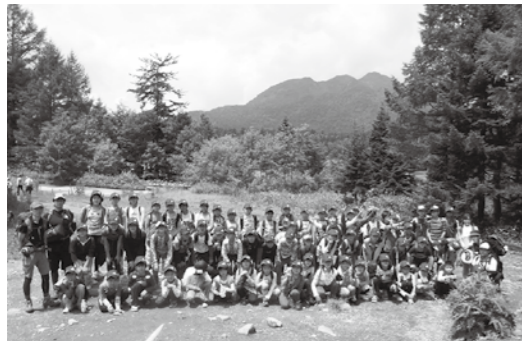
▲参加者全員で記念撮影

鏡石町の子ども達は夏休みにこんなことをしていました。スポーツに旅行に勉強に忙しくも楽しく過ごしていたようです。 ◎日時 ◎場所