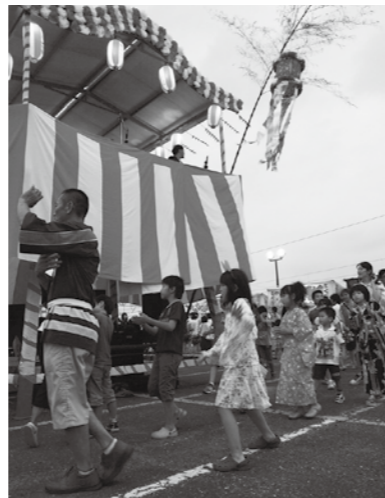
▲ふるさと祭り(駅前盆踊り)

4つの盆踊りは、太鼓や笛などのリズムも少し違っており、地区ごとに特色があります。まだ参加したことがない方や最近踊っていない方は、夏の風物詩である盆踊りに来年は参加してみたいかかでしょうか。