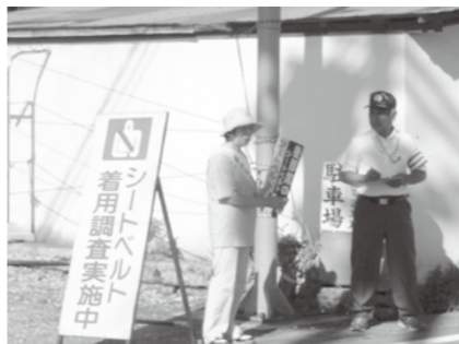
▲シートベルトは皆さんの命綱です。全席シートベルトを着用しましょう