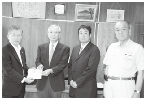
▲復興のためにと義援金を手に訪れた(社)福島県エルピーガス協会須賀川支部、同青年委員会のみなさん