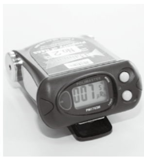
▲福島県より配布された機器で、台数に限りがあります

量の把握のために、計測値報告書の提出のご協力をお願いします。 ◆予約方法 貸出を希望される方は健康福祉課までご連絡ください。 ◆貸出場所 勤労青少年ホーム内健康福祉課窓口 ◎問い合わせ先 健康福祉課 ☎62-2115