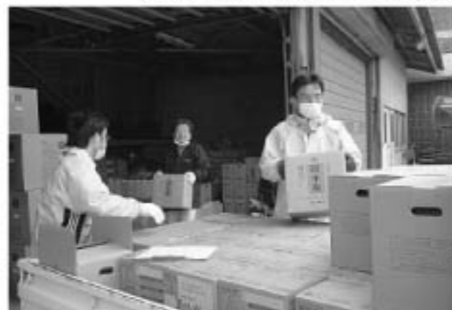
▲数に限りがあった支援物資は災害弱者へ重点的に配給