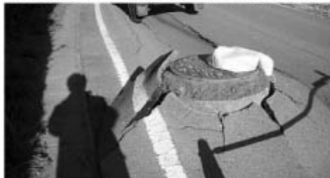
▲道路上に飛び出した下水マンホール、町内全域でこのような光景が見られました