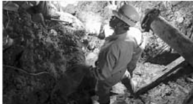
▲旭町浄水場では夜を徹しての修繕工事が行われました