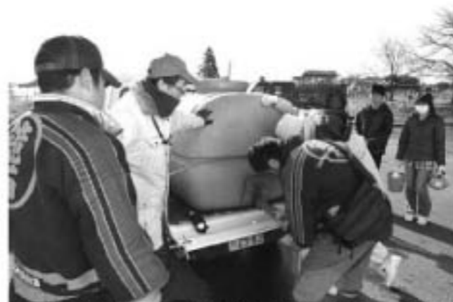
▲給水車で各地区を巡回、消防団や区長さんにご協力いただきました