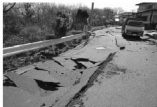
▲地震直後、危険な状態だった道路も、地元事業者の協力により早期に応急的に復旧