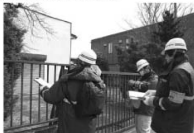
▲風から派遣された専門家による住宅密集地の被害確認