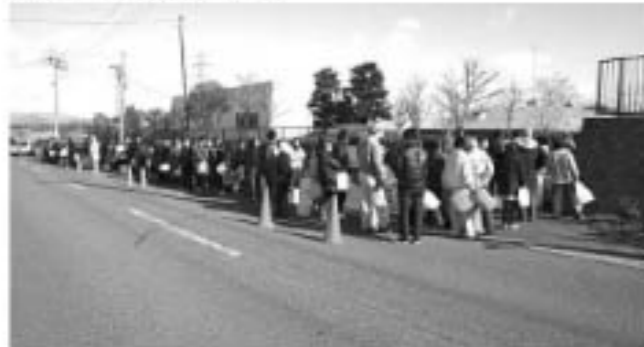
▲新水当初の混乱時には、浄水所で長蛇の列となりました