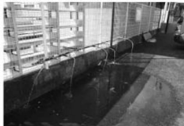
▲水道の復旧に伴い、各地区に拠点となる給水所を設置