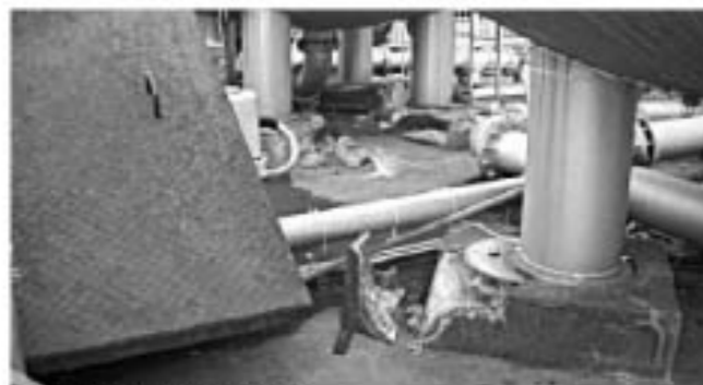
▲各浄水場でも深刻な被害