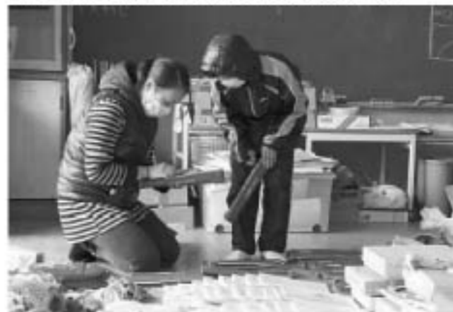
▲保護者の有志が、壊れた一小校舎から、子供たちの道具を集めてくれました