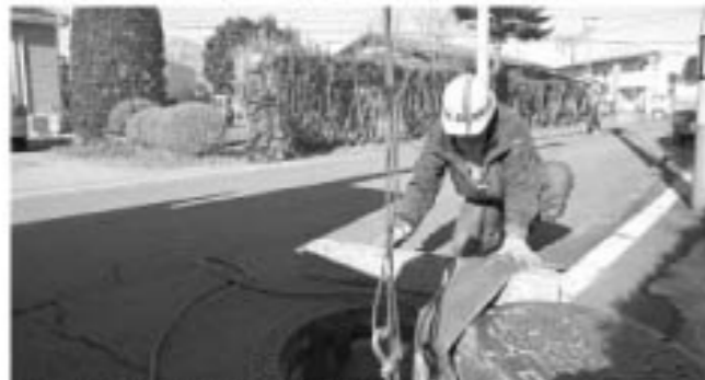
▲下水の復旧も急ピッチで進められています