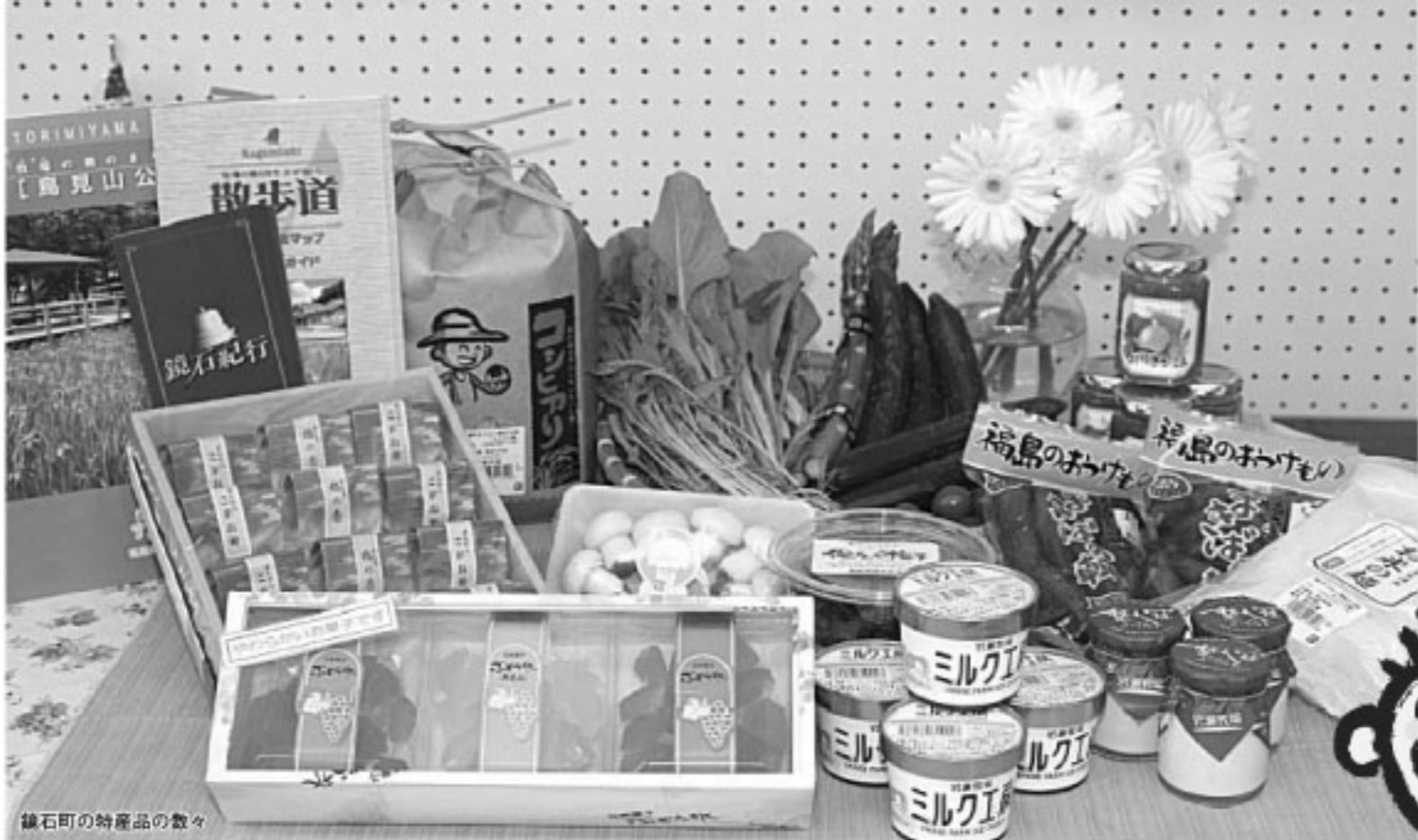
鏡石町の特産品の数々