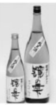
▲さっぱりしてさわやかな味で評判の「鏡の雫」

町観光協会では、新しい町の特産品として、特別栽培米コシヒカリの「牧場のしずく」から醸造した「鏡の雫」を企画しました。評判は上々で、3月に町内の販売店で販売されると一ヵ月を待たずに、今年醸造した分はすぐに