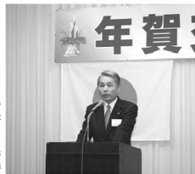
▲新年のあいさつをする木賊町長