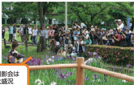
あやめ撮影会は今年も大盛況