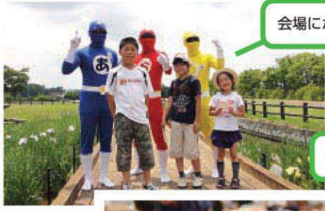
会場にポイ捨てさせない！あま隊