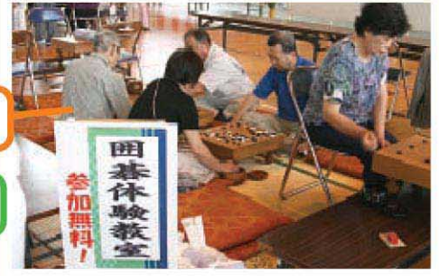
囲碁の体験教室は大賑わい