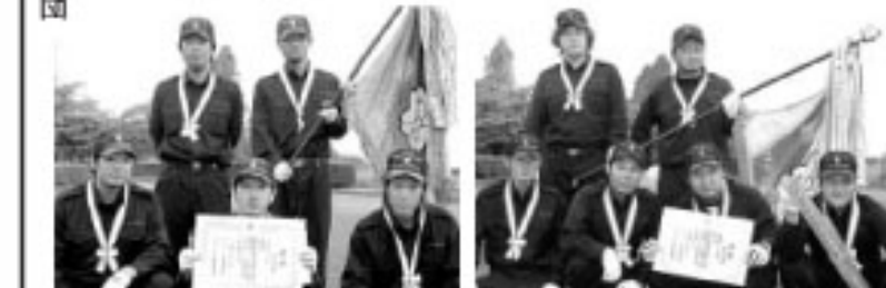
▲小型ポンプの部 優勝 第8分団(高久田地区) ▲ポンプ車の部 優勝 第5分団(成田地区)