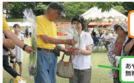
あやめ(株)のあやめの無料配布には大行列