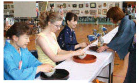
野点でお茶に挑戦、異文化交流