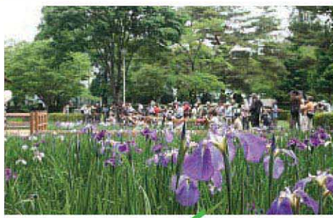
春先の寒さで7分咲きだったあやめ