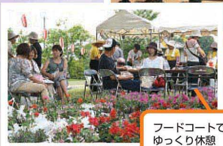
フードコートで花に囲まれてゆっくり休憩