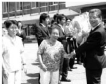
初登庁には多くの町民らが、詰め掛けました。

いま、時代は変わろうとしています。地方の自治体の声が日本を動かすこともあり得ます。大切なのは、新しい時代に向けて、常に新しい発想を持ち改善の努力を積み重ねることです。町民にとって、どうあるべきか、どのように改善すべきかを徹底的に検討し実行に移すことであると思っております。そのためにも町