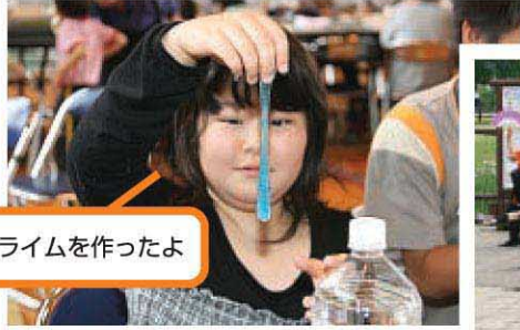
理科教室でスライムを作ったよ