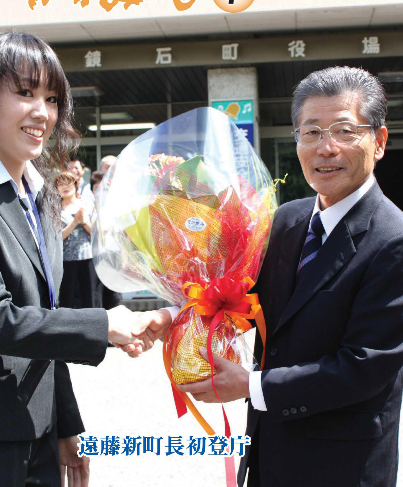
遠藤新町長初登庁