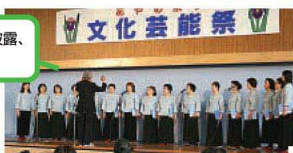
日頃の練習の成果を披露、文化芸能祭