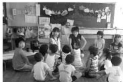
▲保育園で、小さな子ども達のお世話