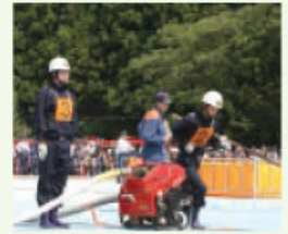
▲ ピンと伸びた指先、規律厳正な姿勢