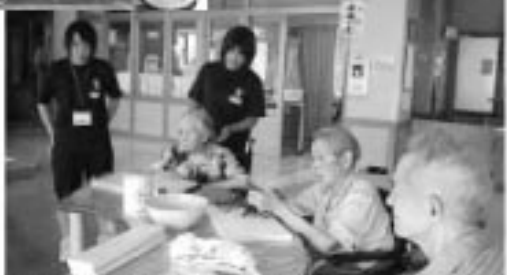
▲鏡石ホームで高齢者の生活のお手伝い