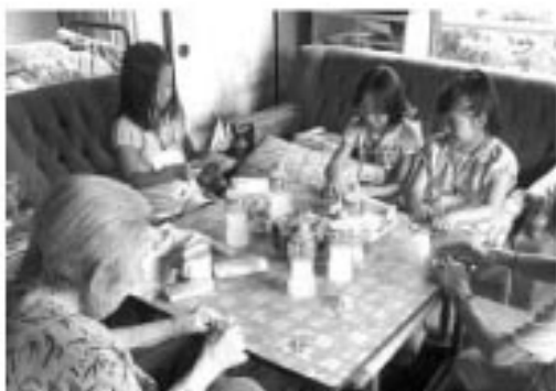
▲一人暮らしの高齢者宅で話を聞く子ども達