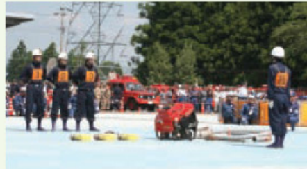
▲ 酷暑の中で迎えた本番