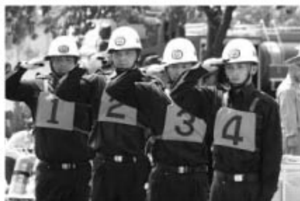
▲ピタリとそろった敬礼

惜しくも県大会出場はなりませんでしたが、その一糸乱れぬ規律は大会屈指との評判でした。