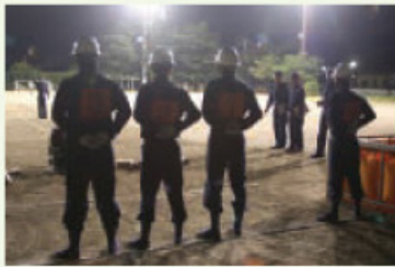
▲ 連日夜遅くまで行われた訓練