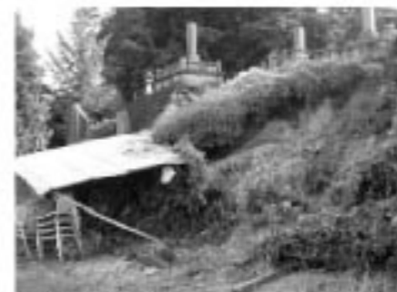
▲大雨で倒れた土手

7・26 大雨被害 7月25日から26日にかけて、鏡石町で局地的に降った大雨により、町では、各地で土砂崩れなど大きな被害が出ました。 今回の雨では二日間の総雨量が138.5mmで一時間当たりの最大降雨量が48.5mmと、天気予報での表現だとバケツをひっくり返したような雨が降りました。 近年では全国でこのようなゲリラ豪雨が頻繁に発生しています。災害はいつ発生するかわかりません。今回の大雨をきっかけにご家族でも災害対策についてぜひ話し合ってみましょう。