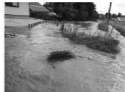
▲増水し溢れた河川

7・26 大雨被害 7月25日から26日にかけて、鏡石町で局地的に降った大雨により、町では、各地で土砂崩れなど大きな被害が出ました。 今回の雨では二日間の総雨量が138.5mmで一時間当たりの最大降雨量が48.5mmと、天気予報での表現だとバケツをひっくり返したような雨が降りました。 近年では全国でこのようなゲリラ豪雨が頻繁に発生しています。災害はいつ発生するかわかりません。今回の大雨をきっかけにご家族でも災害対策についてぜひ話し合ってみましょう。