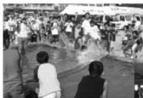
▲負けたらびしゃんこになっちゃうぞ

また、鏡石駅前盆踊り保存会による盆踊りが二日間にわたって行われ、お年寄りから子どもまで夏の夜を踊り明かしました。