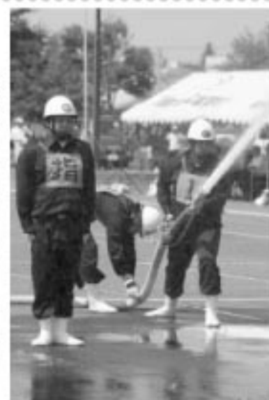
▲火点めがけて放水開始!