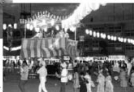
▲賑わった盆踊りで踊りを観る参加者