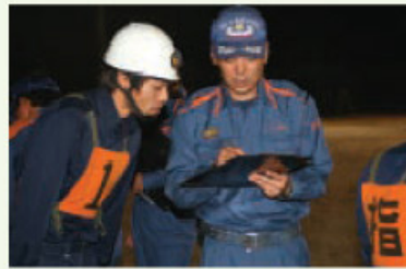
▲ 消防署職員による熱の入った指導