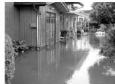
▲床下浸水の被害も多く発生しました。

9月9日は「救急の日」です 救急の日、昭和57年に救急医療及び救急業務に対する国民の理解と認識を深め、救急医療関係者の意識高揚を図ることを目的として定められました。 ■もし、今あなたの大切な家族、友人の心臓や呼吸が止まったら… 普段何気なく生活している中で、あなたの大切な人がいつどこで病気がけがおそわれるかわかりません。つききまで一緒に話していたのに、突然、心臓や呼吸が止まってしまい倒れてしまった…。その場に居合わせたあなたは どうしますか？ 下の図1をご覧ください。心臓や呼吸が止まってしまっただけで、命が助かる可能性を、その場に居合わせた人が処置をした場合と救急車が到着するまで何もしなかった場合をグラフで表したものです。何もしなかった場合に比べ、処置をした場合は命が助かる可能性が緩やかに上がっているのがわかります。 あなた、大切な人の命を救うのは、その場に居合わせたあなた自身なのです。