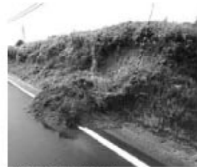
▲雨れた土手が道を覆う

このコーナーにご協力いただける方を募集します。故郷の思い出を語ってみませんか。お問い合わせは、町総務課(☎62-2111)までお電話ください。