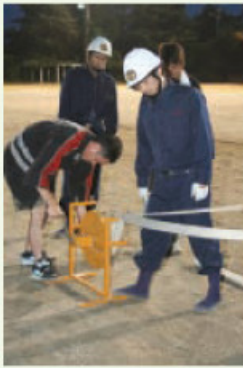
◀ 団員全員が一つになって臨みました