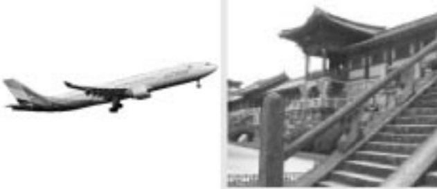
鏡石町民友好の翼事業韓国周遊(釜山、慶州、ソウル)4日間行程表