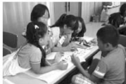
▲研修でどのような活動をするかを勉強