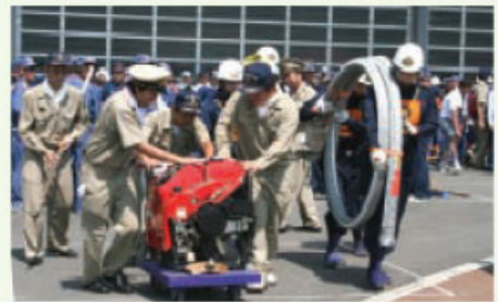
▲ 「さあ! 行くぞ!」 気合を入れて競技へ向かう選手と団員