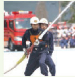
◀ 火点めがけて集中