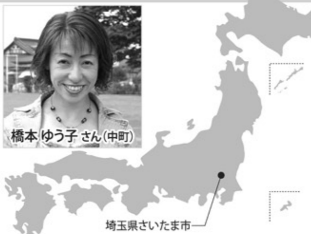
埼玉県さいたま市