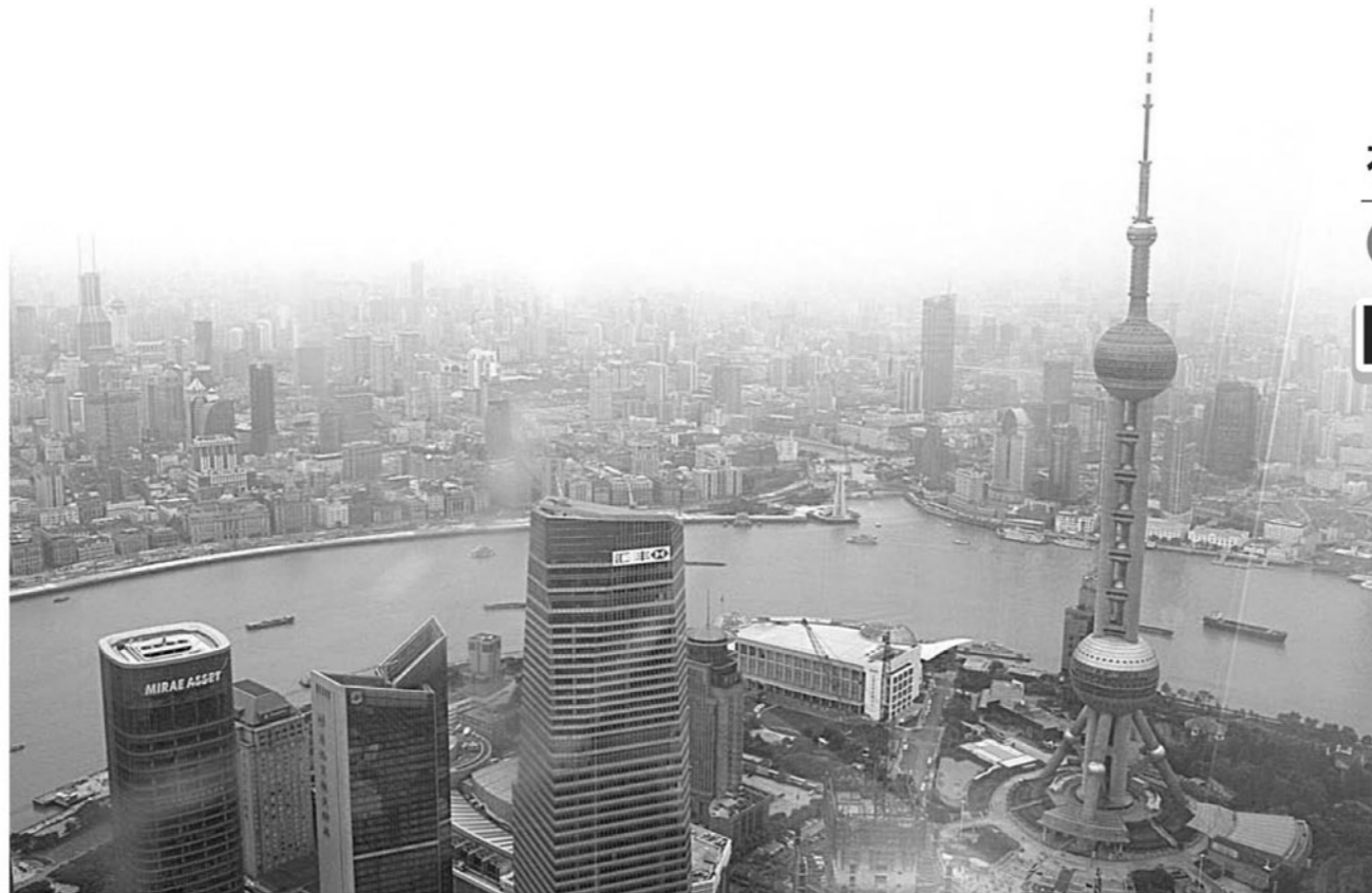
高層ビルが建ち並ぶ大都会 上海