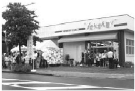
8月 鏡石まちなか情報交流館

れたあがりのスペースもあります。ちよつとした会議にもご利用ください。がなかん館は、午前9時から午後5時まで、年末年始を除く毎日開館して皆さんのご来館をお待ちしています。観光情報の拠点としての役割を担っています。