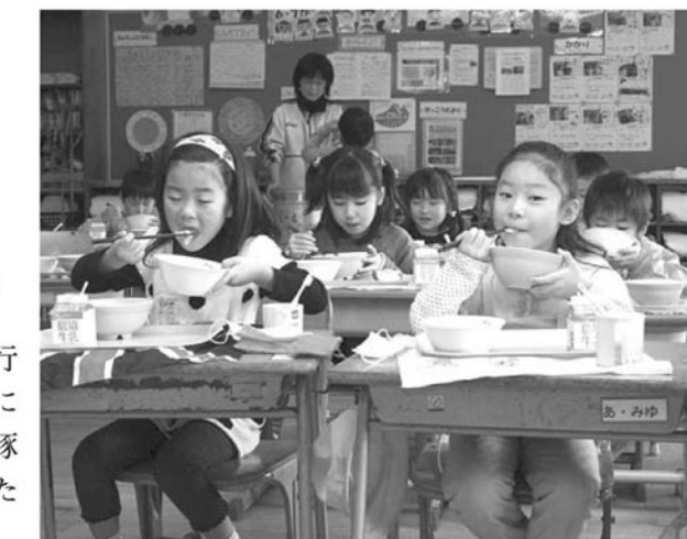
▲豚丼を口いっぱいほおぼる児童