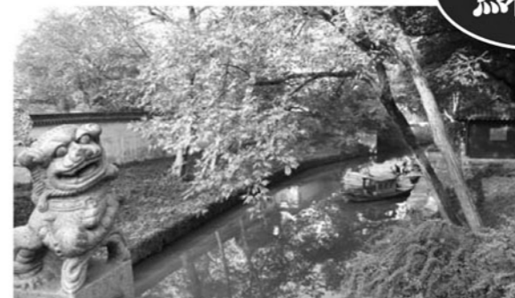
世界遺産古典庭園の留園