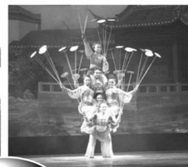
上海雑技団の素晴らしいショー