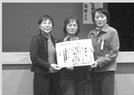
▲食生活改善推進委員会を代表して受賞した皆さん

福島県社協主催「第13回ふくしまボランティアフェスティバル」が11月14日（土）パルセいいざか（福島市）で行なわれ、表彰式において、鏡石町から「声の広報ボランティア」「配食サービスボランティア」が県社協会長表彰を、「町食生活改善推進委員会」が同会長感謝状を受賞されました。3団体は、長年のボランティア活動の実績が認められたものです。