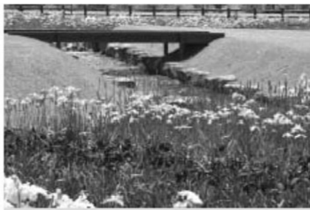
6月 鏡石あやめ祭り