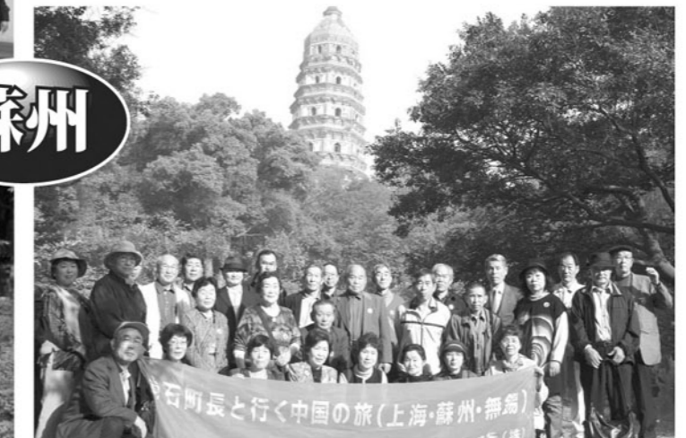
中国版ピサの斜塔 虎丘