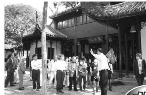
ガイドの説明に耳を傾ける参加者