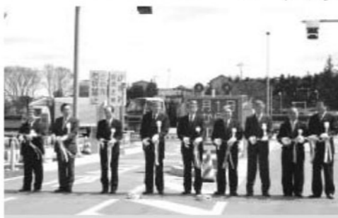
4月 鏡石スマートインターチェンジ

は変更となったものの、本格運用により、交流人口の増加、救急医療の迅速化などの整備効果が発揮されています。さらに、町内で開催されるイベントへの来場促進など高速交通ネットワークの玄関口として大きな役割を担っています。