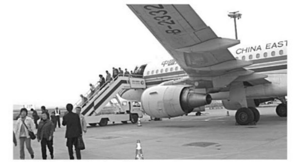
上海空港に降り立った一行