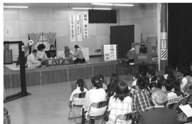
▲大掛かりな舞台セットで披露

町民生児童委員協議会高齢部会7人による劇団「おいドル」の寸劇披露は、11月12日（木）町勤労青少年ホームで行われ、児童クラブ3年生約30人が鑑賞しました。この寸劇は、認知症を知ってもらおうと始められたもので、認知症の主人公の家庭での模様を分かりやすく描いたものです。