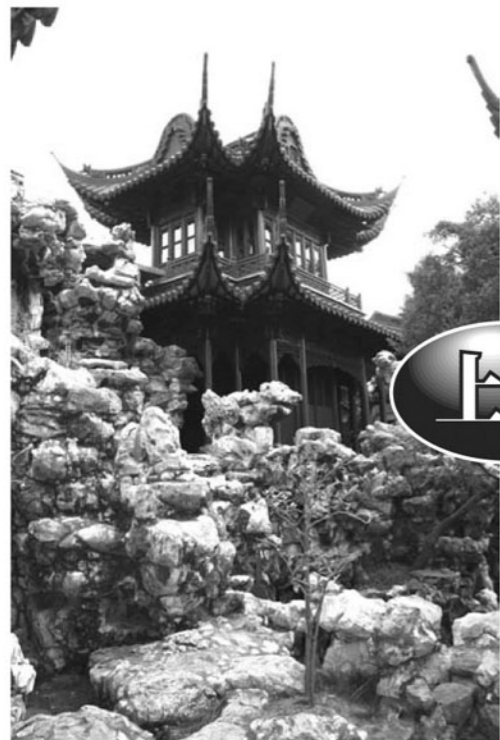
広さ2万㎡の広大な敷地を誇る豫園