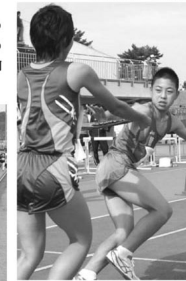
▼タスキリレーする選手