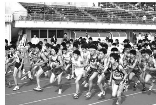
▲一斉にスタートする中学男子5kmの部

今年で5回目となる鏡石駅伝・ロードレース大会は、11月1日（日）鳥見山陸上競技場を会場に行われました。大会は、ロードレースの部、駅伝競走の部に分かれて行われ、秋晴れの中、932人のランナーは健脚を競っていました。