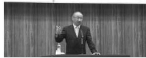
2月 かがみいしスポーツクラブ始動