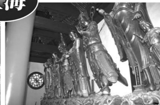
上海で最も参詣者が多い玉仏寺