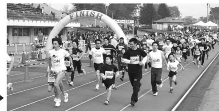
▲手をつないで走る親子1.5kmの部

今年で5回目となる鏡石駅伝・ロードレース大会は、11月1日（日）鳥見山陸上競技場を会場に行われました。大会は、ロードレースの部、駅伝競走の部に分かれて行われ、秋晴れの中、932人のランナーは健脚を競っていました。