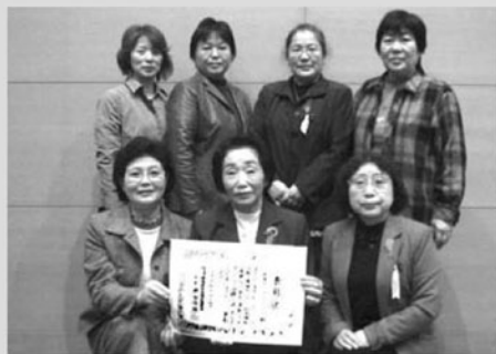
▲配食ボランティアを代表して受賞した皆さん