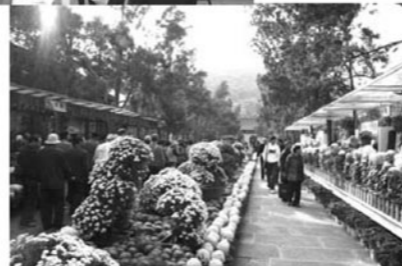
菊の花が美しい公園内