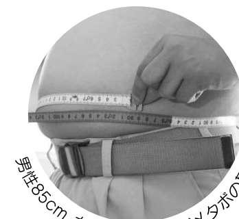
男性85cm、女性90cm以上がメタボの基準