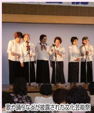
歌や踊りなどが披露された文化芸能祭