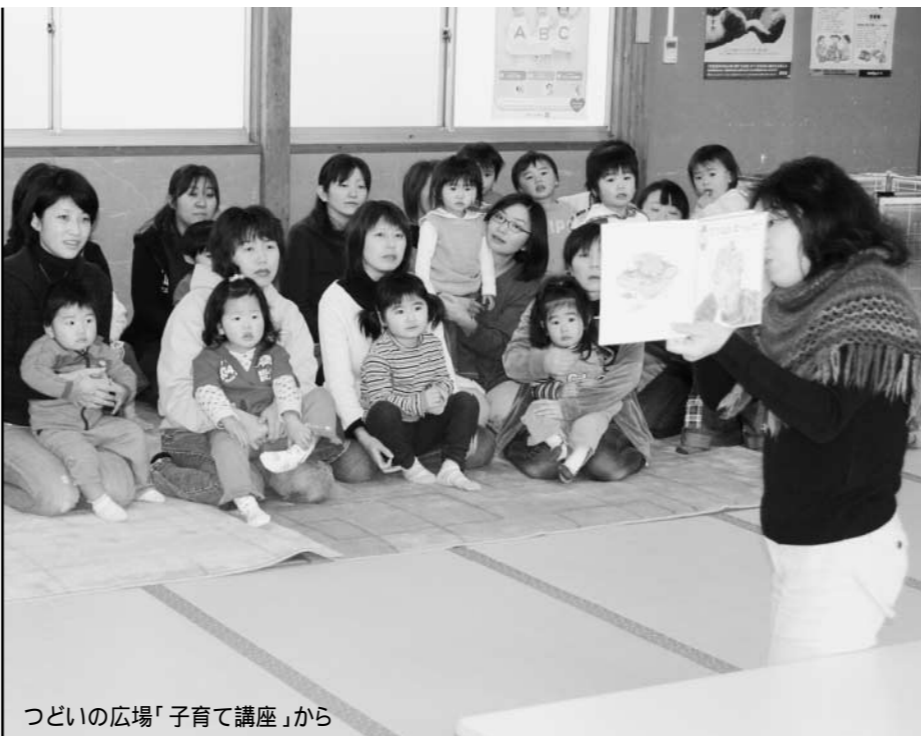
つどいの広場「子育て講座」から