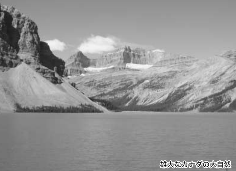
雄大なカナダの大自然