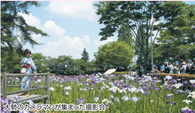
大勢のカメラマンが集まった撮影会

鳥見山公園には、6月下旬になるとあやめ約4万株が美しい紫色の顔を見せます。「良い便り」、「うれしい便り」などを花言葉に持つあやめですが、その咲き誇る姿は町にとってまさに「うれしい便り」となるでしょう。