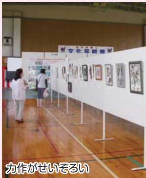
力作がせいぞろい