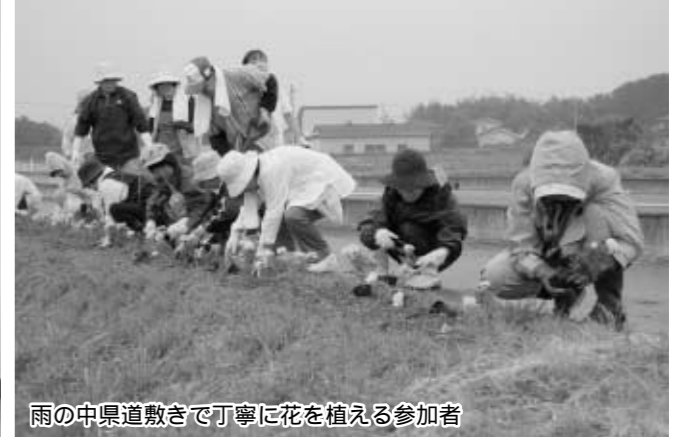
雨の中県道敷きで丁寧に花を植える参加者

油絵は、縦1.3m、横1.5mの大作で、鳥見山公園のあやめが題材となっています。この油絵は、役場1階ロビーに展示されていますので、みなさん是非ご覧ください。