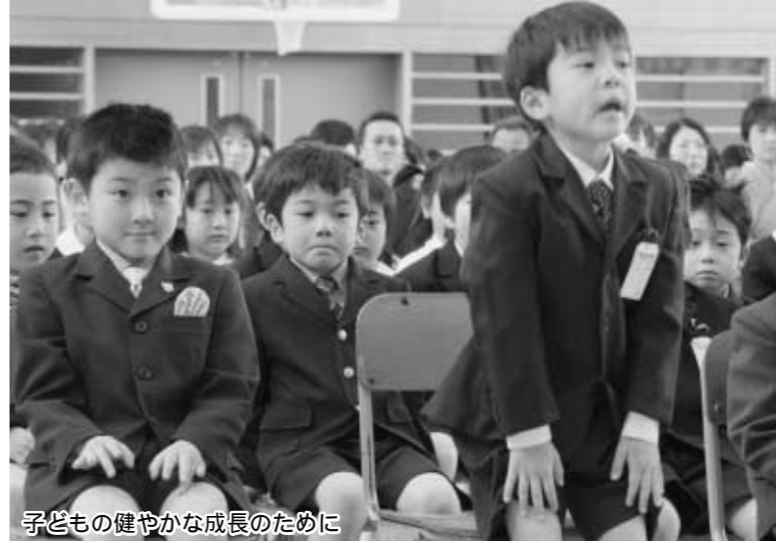
子どもの健やかな成長のために

全国一斉に「ふるさと納税制度」が始まりました。この制度はふるさとを応援したい、大切にしたいなどの気持ちを形にしようとしたものです。ここで、この制度への町の取り組みを紹介することにより、離れて暮らすみなさんのご家族などへこの制度への協力を呼びかけるものです。