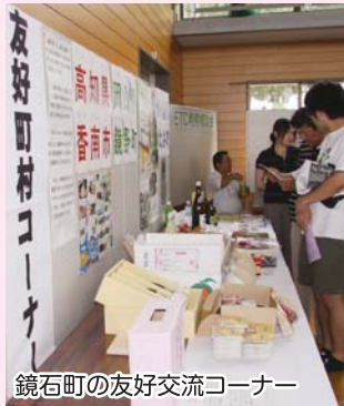
鏡石町の友好交流コーナー