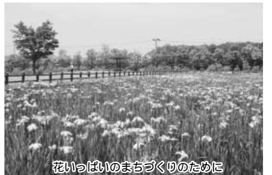
花いっぱいのまちづくりのために