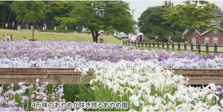
4万株のあやめが咲き誇るあやめ園