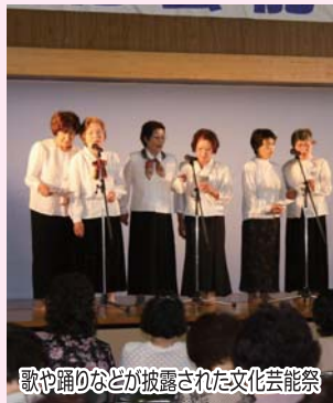
歌や踊りなどが披露された文化芸能祭