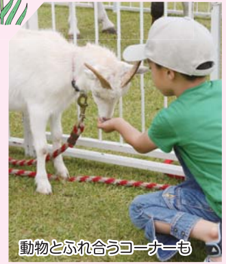
動物とふれ合うコーナーも