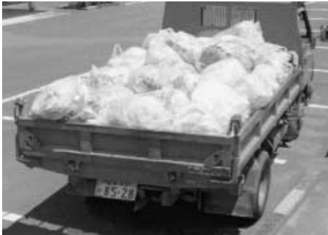
1年間の家庭ごみの量はトラック一杯に

この事業は町を花でいっぱいにとしようとした取り組みで、今年はマリーゴールド、サルビアなど約2万株の花が町内に定植されました。