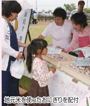
地元米を使ったおにぎりを配付