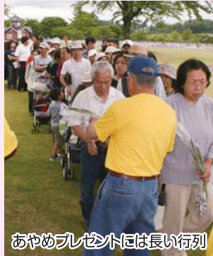
あやめプレゼントには長い行列

18日(水)町立幼稚園、保育所の子供たちが、あやめ300株を鳥見山公園鑑賞池に一斉定植しました。参加した子供たちは大きく育つよう一生懸命、気持ちを込めてあやめの苗を定植していました。