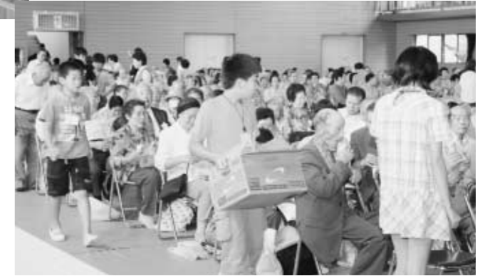
▲小学生15人もボランティアとして参加