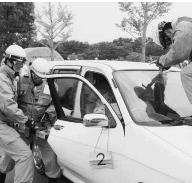
レスキュー隊による車両からの救出訓練

須賀川消防署のはしご車、町消防団ポンプ車による放水訓練を実施。強風による延焼拡大防止を図る。