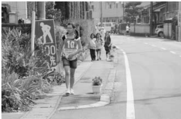
▲チェックポイントを探す参加者

町総合型地域スポーツクラブ設立準備委員会は、9月20日(土)鳥見山公園をスタートに3.4キロのコースを歩くウォークラリーを開催しました。当日は、37チーム、142人が参加して、チーム毎に6カ所のチェックポイントを巡りました。上位入賞者に賞状と参加者全員に記録証が交付され、参加者は、チェックポイントでの問題に苦戦しながらもウォーキングを楽しみ、ふるさとを再発見していました。