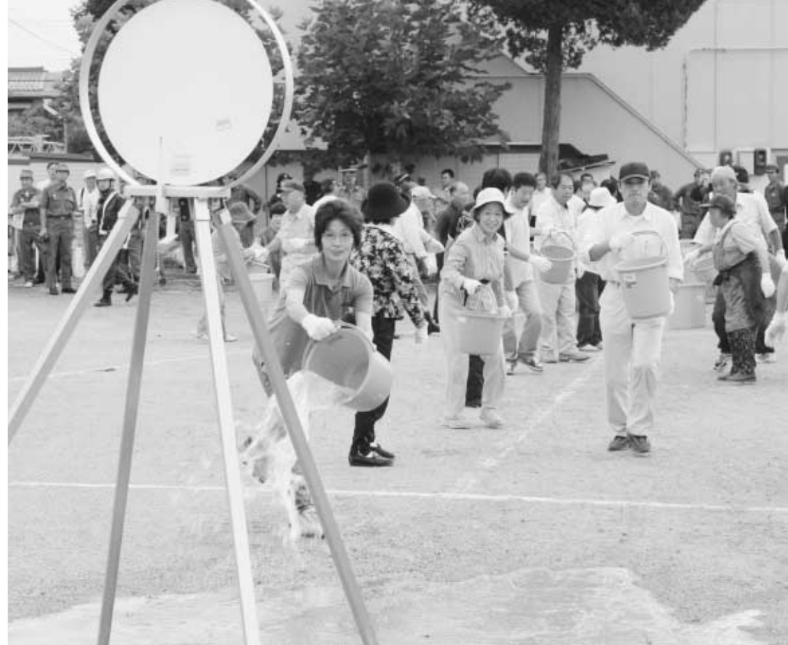
初期消火の基本となるバケツリレー