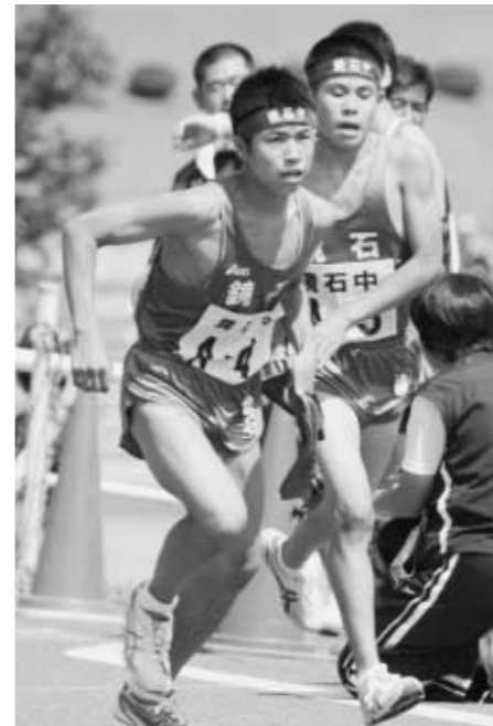
▲タスキリレーする男子チーム