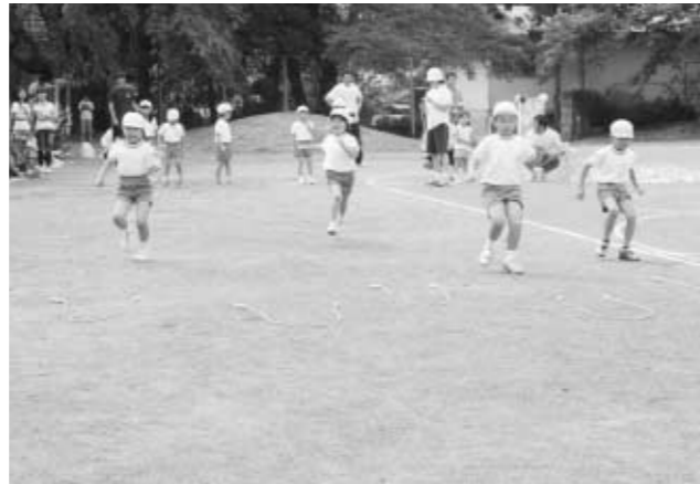
▼元気に種目に取り組む園児たち