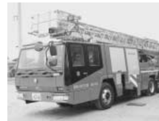
須賀川消防本部からはしご車が出動し、25mの高さから放水。