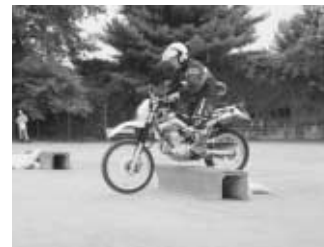
県警本部災害警備先遣隊モトクロス班が出動し、災害状況を災害本部に報告。