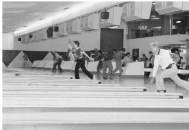
▼ハイスコア目指して投球する参加者

成田幼稚園のふれあい運動会が9月20日(土)成田保健センターグラウンドで開かれ、園児や大勢の区民が参加しました。運動会は26種目で構成され、園児だけでなく行政区や老人会、地元消防団などが参加して行われました。「笑顔が広がる 地域の輪」をテーマとした運動会では行政区一丸となって運動会に取り組んでいました。