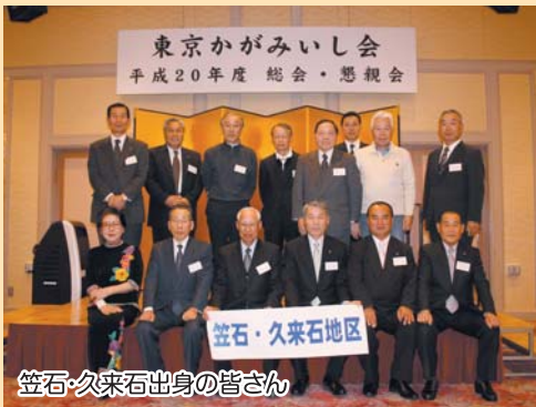
笠石・久来石出身の皆さん