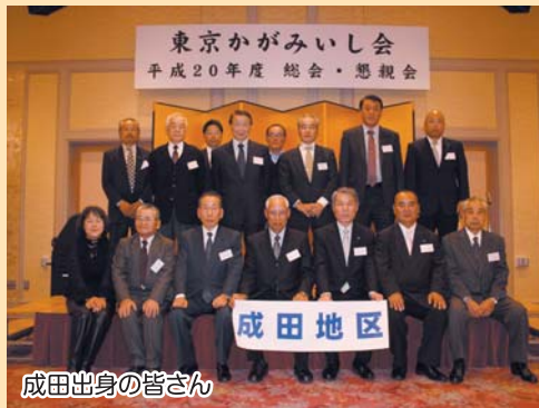
成田出身の皆さん