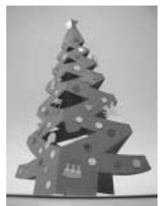
このような作品を作ります

日時 12月23日(火) 午後1時30分から3時まで 内容 立体カードづくり 『ツリーをかざろう』