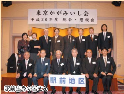
駅前出身の皆さん