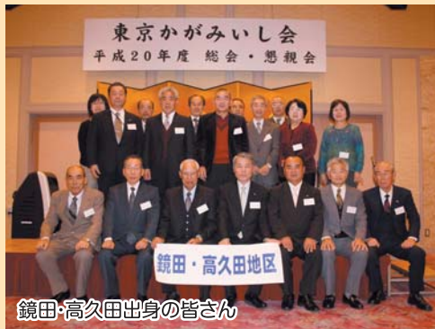
鏡田・高久田出身の皆さん