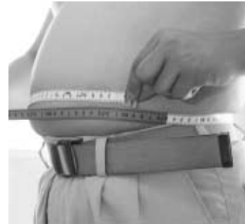
▲ウエスト85cm(男)90cm(女)がメタボの基準

今年度から始まった「鏡石町特定健診」の結果、男性の『メタボ&メタボ予備群』が受診者の47%見られました。1月からは、内臓脂肪を減らし、将来の臓器障害を予防するための『特定保健指導』が始まります。後日、該当者の皆様へ「特定保健指導利用券」を送付し、脱メタボチャレンジを支援することになりますので、よろしくお願ひします。