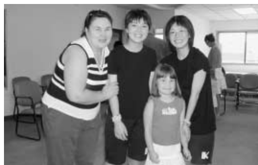
ホストファミリーといっしょに！

カナダは、とてもきれいで大きなところでした。日本にはない高くそびえた山々、「永遠」と言える程長大な湖等、日本とは全く違う自然環境で、とても楽しい思い出をつくる事ができました。また、日本にはない、たくさんの動物に出会う事ができ驚く事が多かったです。ホームステイ先でも、湖が見渡せるノックス山など色々な場所に連れてって頂きました。食事はどれもおいしく、優しい家族に出会えた事を嬉しく思っています。またいつか、カナダに帰りたいです。