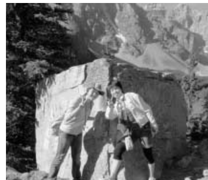
カナダの大自然に感動