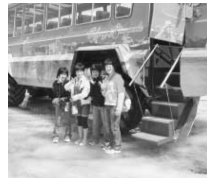
コロンビア氷河を見学