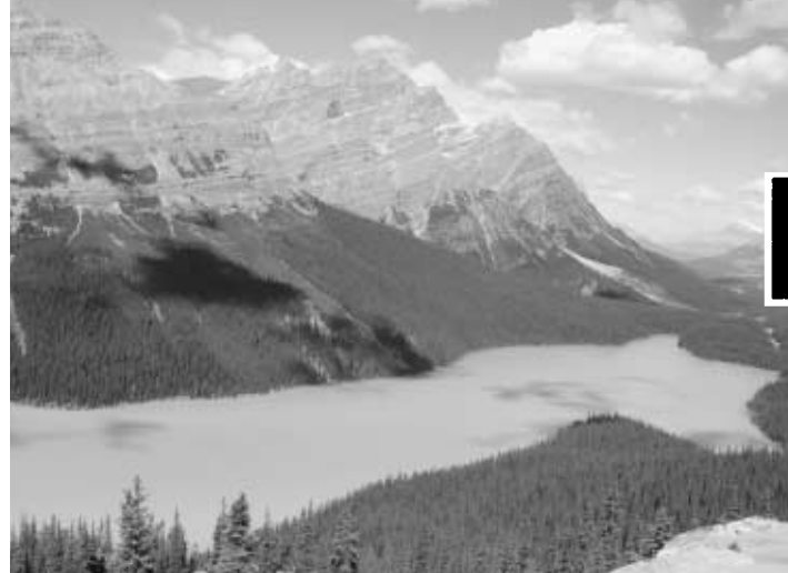
雄大なカナダの大自然

11日間の研修は、初めてのことがたくさんありました。飛行機に乗ることやホストファミリーとの生活です。カナダについて2日間パンフに泊まり、友だちと一緒に楽しく過ごしました。2日目から6日間はホームステイを体験しました。ホームステイ先には、ホストファミリーのほかに、メキシコ人や日本語が話せる人がいました。その2人とも仲良くできて楽しかったです。食事の時間が特に楽しく一番でした。この11日間は、忘れられないことばかりでした。