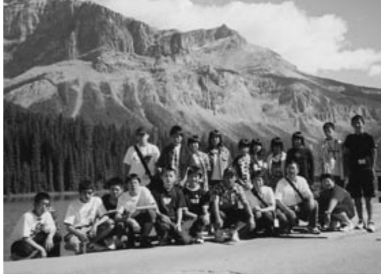
楽しかったカナダ