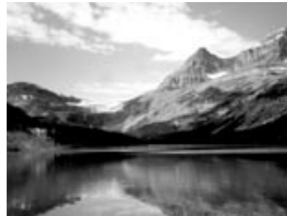
雄大なカナダの大自然

今回の中学生海外文化学習事業に参加し、いろいろな面で貴重な体験をすることができました。生徒たちとの関わり、カナダの人たちの自然との共生、英語力がなくても自分からチャレンジしていけば相手に伝わるということ。生徒たちも11日間家族と離れ一人で行動したのは初体験だったと思いますが、雄大な自然に触れたことやホームステイ体験をこれからの学習や生活に活かしてほしいと思います。保護者のみなさま、関係者のみなさまに感謝します。