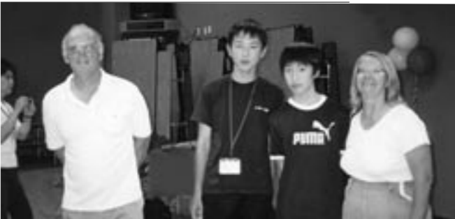
ホストファミリーとの楽しい生活