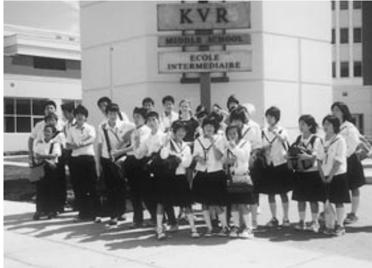
平成14年にカナダを訪れた団員のみなさん