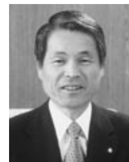
鏡石町長 木 賊 政 雄

地方分権の推進や市町村合併、三位一体改革など、今、地方は新たな行政需要に対する新しい取り組みが求められるています。町ではこれらの課題解決のため、広域行政に関する研究会や全世帯への町民アンケート、町民懇談会などして、今回の行政改革大綱の