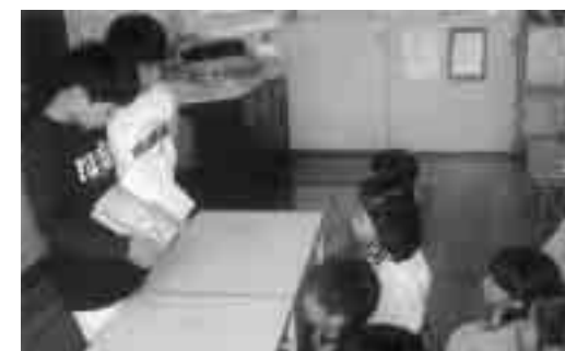
「読書活動・読み聞かせ」をしています

【創立130周年記念】 記念事業として、「バザー」「祝つ会」「記念誌発行」等を予定しています。PTAを中心に、実行委員会を組織して取り組んでいきますが、バザーは6月28日に、「祝つ会」は9月19日に実施し、子ども達にはその中で活躍する場を設定したいと考えています。