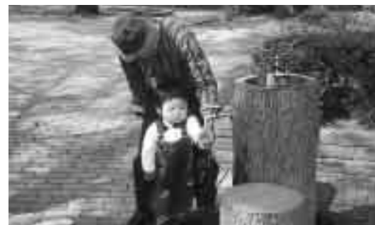
水は限りがある貴重な資源。大切に使いましょう