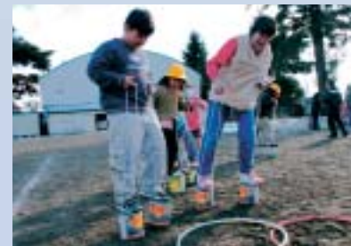
校庭で元気に缶ポックリ