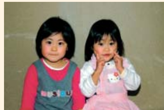
すすき もりの ちゃん(左)・ことの ちゃん(右)(さかい)