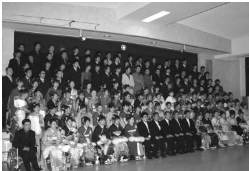
129人が出席した成人式