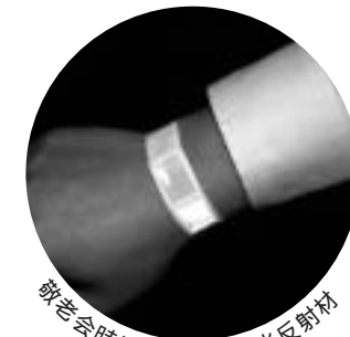
敬老会時に配布した夜光反射材

高齢者の交通事故多発 夜間は、ドライバーから歩行者が見えにくくなります。こうした中、歩行中の高齢者の交通事故が依然として多い状況にあります。昨年11月未現在の県内の交通事故による死者数は153人で、その内高齢者の数は56人です。また、傷者数は2,112人となっています。 高齢死者数を状態別で見ると、歩行中が30人で最も多く、全体の半数以上を占めています。次いで多いのは、自動車運転中の14人となっています。 町交通対策協議会では、こ