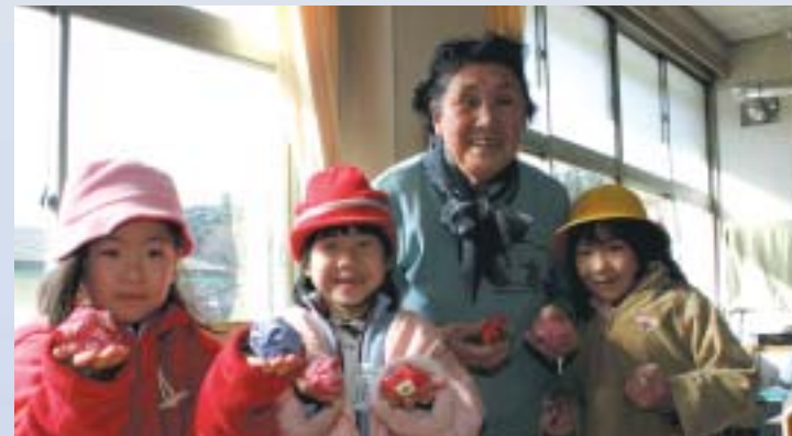
老人クラブの方々とお手玉を楽しむ児童