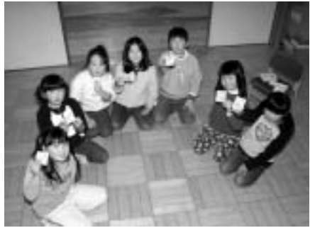
児童館ではかるた大会などを開催しています