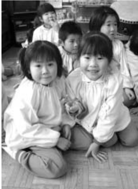
町民一人ひとりのしあわせのため、税金は大切に使われています