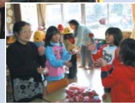
一番長くできるの誰だ!

鏡石一小では1月16日(金)、午前10時30分から新年集会を開催し、町老人クラブの方々と昔ながらの遊びを楽しみました。 当日は、児童637人と、町老人クラブから40名が参加し、教室や体育館、校庭を使って、はねつき、こま回し、かるたとり、お手玉などを行いました。 最近では、お正月でもすることのない遊びですが、児童達は、老人クラブの方々に遊び方を教わりながら楽しい時間を過ごし、新年を祝いました。