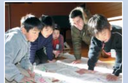
一番にゴールするのは誰かな (スゴロク)