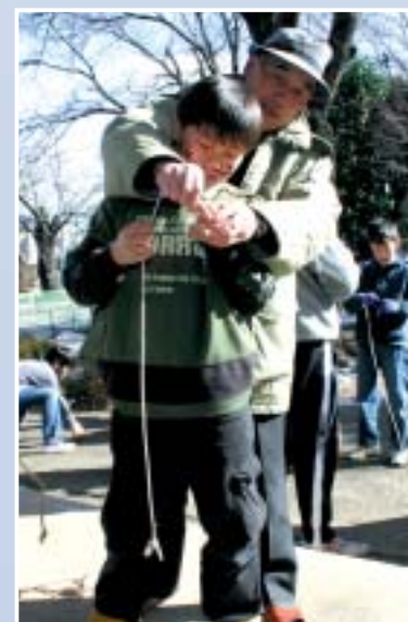
こまの糸のまき方を教わっています