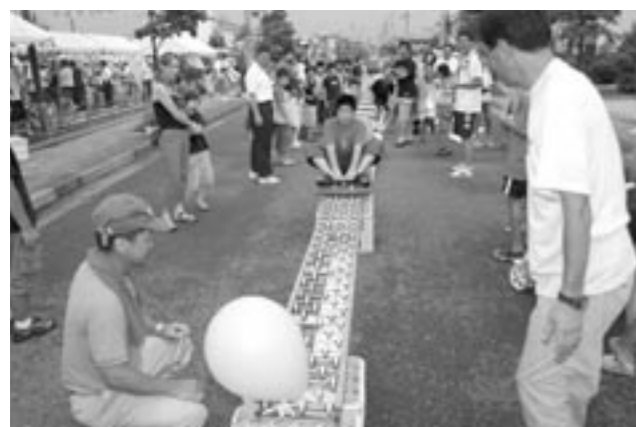
たくさんの観衆で盛り上がるトロコチキンレース

夏祭り実行委員会主催の「2004かがみいし夏祭り」が8月7日(土)午後4時から鏡石駅前駐車場で開催されました。 当日は、雨が降るあいにくの天気でしたがトロコチキンレースやビール早飲み大会、魚つかみ取り大会、懸賞付き盆踊りなど多くのイベントが行われました。 会場には、夏休み中の子どもなど、多くの町民の方々が訪れ、夜遅くまでお祭りを楽しみました。