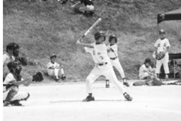
晴天の下、熱戦が繰り広げられました

元気カップ東日本実行委員会主催の第8回元気カップ東日本大会が8月6日(金)から8日(日)の3日間、町鳥見山野球場などで開催されました。 大会には、東京・埼玉など東日本各地から男女33チームが参加し、優勝を目指して熱戦を繰り広げました。 鏡石町からは、鏡石スポーツ少年団と鏡石ヤンキースの2チームが出場しましたが、健闘及ばず入賞を逃しました。