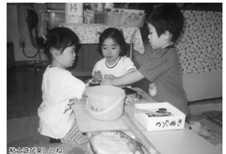
粘土遊びの楽しいね