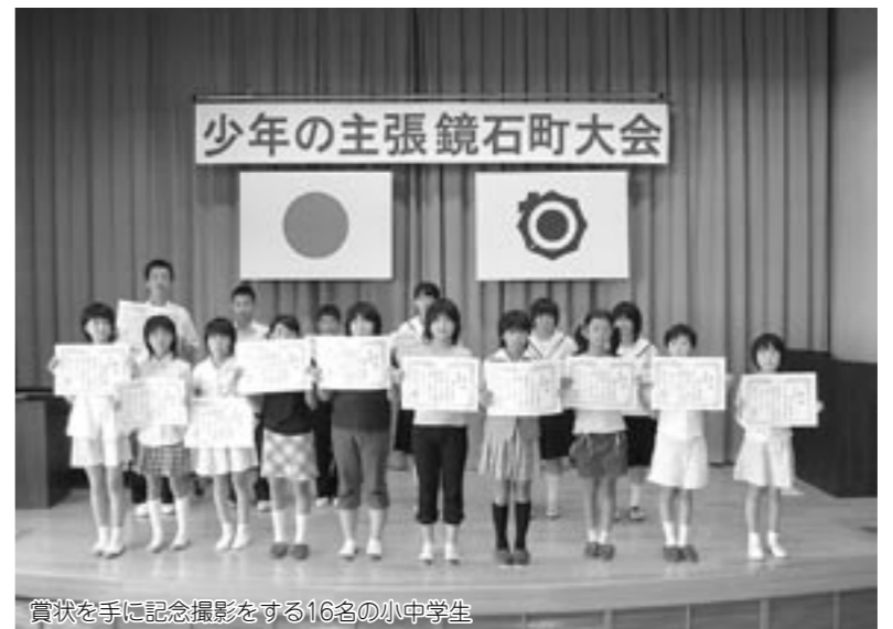
賞状を手に記念撮影をする16名の小中学生

町青少年育成町民会議が主催する第6回少年の主張鏡石町大会が、8月22日(日)午前9時から町図書館で開催されました。 大会では、校内審査で選ばれた鏡石一・二小10名と鏡石中学校6名の16名が、日常、家庭や学校生活の中で考えていること、感じていることを発表しました。