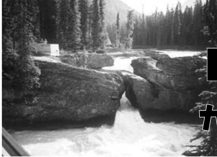
雄大なカナダの大自然

私はカナダに行ってすごく楽しい思い出ができました。「カナディアンロッキー」を見て、すごく感動したし、ホームステイの人達にはいろいろな場所につれていってもらって嬉しかったです。最後には、ホームステイの人達に「YOSAKOI」を見てもらって「すごうまかったよ」「カッコよかった」などと言われ、すごく嬉しかったです。私は、この研修で一生忘れられない思い出ができました。