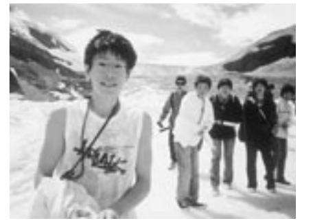
寒いのに大丈夫(コロンビア大氷河)