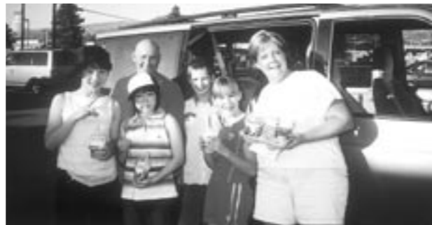
ホストファミリーとの楽しいひととき

カナダでは、多くの家の庭に芝生が貼ってあり、沿道にも緑があふれていました。ホームステイ先の家族は優しく、湖でボートに乗せてもらったり、バイクに乗せてもらったり、色々なところに連れて行ってもらいました。ホームステイ先の家族と別れる時は、さみしくてちょっと泣いてしまいました。家に帰りたくないくらい、とても楽しい研修でした。