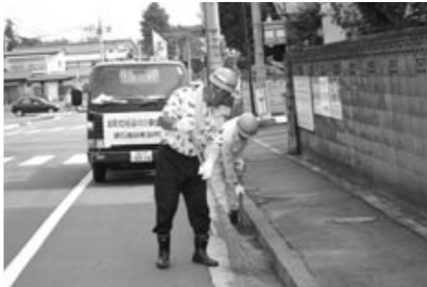
道路に落ちているごみを集める作業員のみなさん

8月10日(火)午前8時から町建設業共同組合では、道路の美化作業を行いました。 この作業は、安全で快適な道路環境を保つことを目的に、8月10日の道の日がある月に毎年行っています。 当日は、約50名の作業員が参加し、スコップで道に落ちているごみや土砂を拾い集めたり、草刈り機で、沿道に生えている雑草を刈り取ったりしました。約4時間の作業でトラック2台分のごみが集まりました。