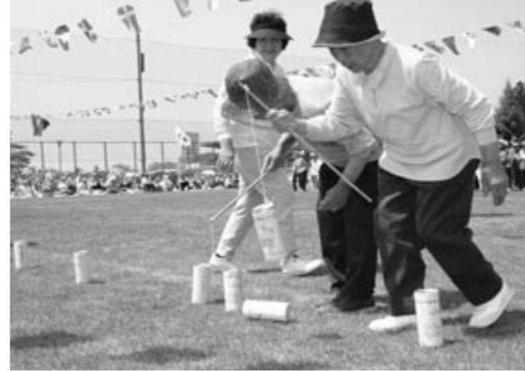
健康で楽しい毎日を

がん・心臓病・脳卒中などの生活習慣病は、日本人の死因の多くを占めています。町で、平成11年から14年に生活習慣病が原因で死亡した方の割合を見ても、毎年、総死者数の半数を超えていることが分かります。これらの病気は、偏った食事や喫煙・お酒の飲み過ぎ・運動不足などが原因の一つとされています。健康な毎日を送るためには、生活改善による「予防」と健診による「早期発見」が重要となります。 町では、9月21日(火)から10月8日(金)まで下表のとおり、各地区集会所等において