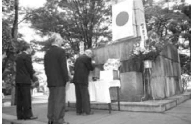
焼香を行い、戦没者の供養をする参加者

町遺族会では、終戦記念日の8月15日(日)正午から、第一小学校わきの忠霊塔前において、戦没者黙とう式を行いました。 式には、木賊町長など町関係者と遺族会員約30人が出席し、正午のサイレンと同時に一分間の黙とうをささげました。 続いて、出席者一人ひとりが焼香を行い、戦没者の供養をするともに、二度と悲惨な戦争が起きないようにと願っていました。