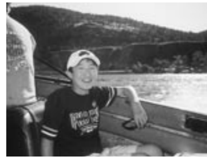
広大な湖でのボートに満面の笑顔

11日間家族と離れカナダという異文化異言語での生活体験は、生徒の皆さんを、精神面で大きく成長させてくれたと信じています。また、雄大な自然やその自然と共生するカナダの人々の姿に触れて、一段と視野が広がったでしょう。多感な時期に、こんな素晴らしい体験をさせていただいた保護者の皆様、そして関係者の皆様に感謝します。この貴重な体験が、今後の生活に生かされ、さらに発展されることを期待します。