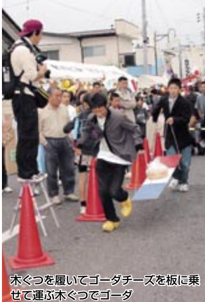
木ぐつを履いてゴダチーズを板に乗せて運ぶ木ぐつでゴダ