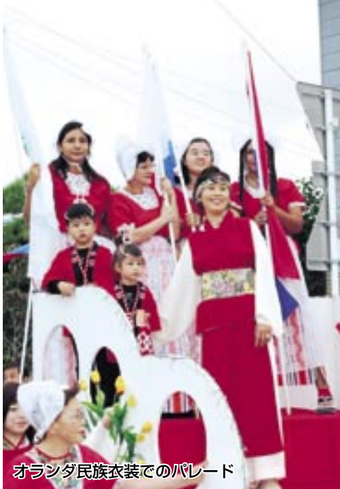
オランダ民族衣装でのパレード