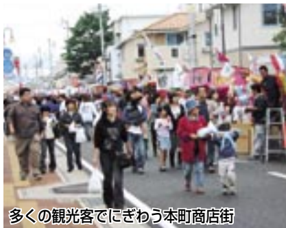
多くの観光客でにぎわう本町商店街