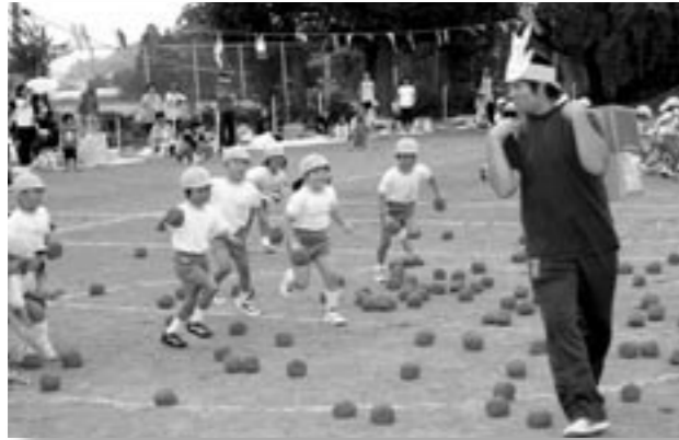
元気いっぱいグラウンドを駆け回る園児たち

当日は、すっきりとした秋晴れとなり絶好の運動会日和になりました。園児20名や父兄、成田区のみなさんが多数参加し、かけっこや綱引き、玉入れなど29種目を行いました。全園児による応援合戦や参加者全員での成田盆踊りも行われ楽しいひとときを過ごしました。