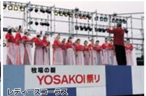
レディースコーラス