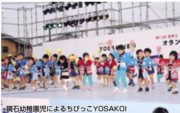
鏡石幼稚園児によるちびっこYOSAKOI