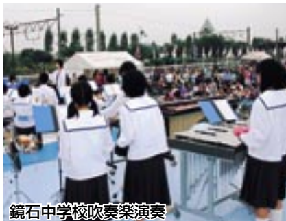
鏡石中学校吹奏楽演奏