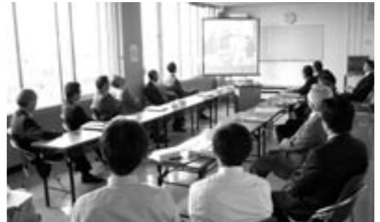
不当要求行為について理解を深めた委員会

四つに、条例化し、不当要求行為等を抑止することをより広く周知する必要があること。そして、五つに、法的根拠を背景に組織として毅然と対応する必要があることがあげられます。また、地方分権が推進され、さらに権限移譲が進むことが予測されることや自治体における賦課徴収業務の重要性が高まってきていることがあげられます。