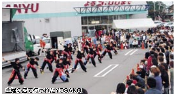
主婦の店で行われたYOSAKOI