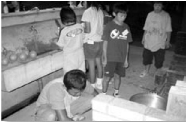
夕食のカレーづくりを行う参加者のみなさん

町商工会青年部が主催する「ふれあいキャンプ」が、9月11日(土)・12日(日)の2日間、ふれあいの森で行われました。キャンプには、町内の3年生から6年生までの小学生と青年部員約40人が参加、一日目は、テント張りを行ったあと、夕食のメニューのカレーづくりや、キャンプファイヤーを、二日目は、魚のつかみ取り大会を行うなど大自然でのキャンプを楽しみました。