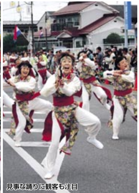
見事な踊りに観客も注目