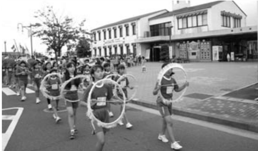
演奏しながら行進する鏡石一小の5・6年生

町交通安全対策協議会が主催する鏡石第一小学校5、6年生による交通安全鼓笛隊パレードが、9月24日(金)午後3時から、鏡石一小校庭から鏡石駅前を一周するコースで行われました。