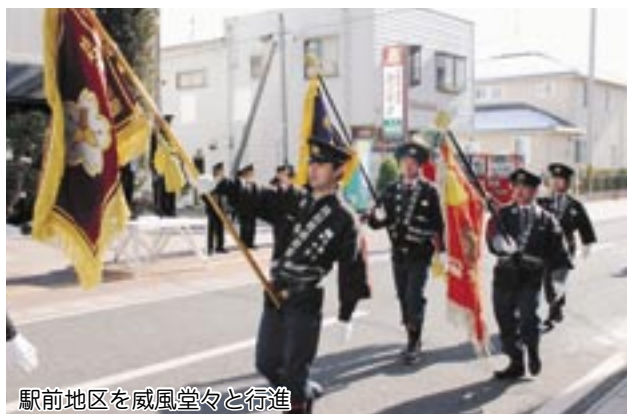
駅前地区を威風堂々と行進

式終了後は、防火パレードが行なわれました。寒風が吹きつけるなか、団員と女性消防隊全員で駅前地区を堂々と行進し、沿道の町民のみなさんに防火意識の向上を呼びかけました。