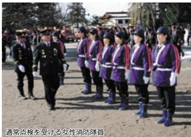
通常点検を受ける女性消防隊員