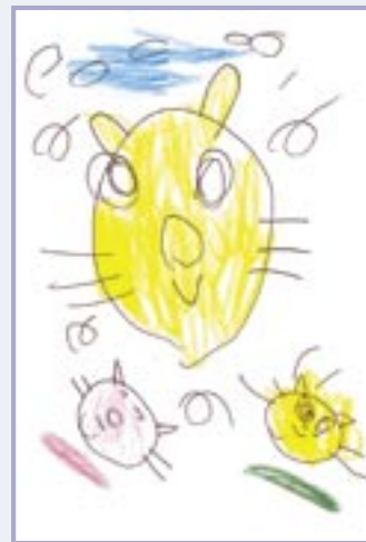
ペンネーム「じゅん」