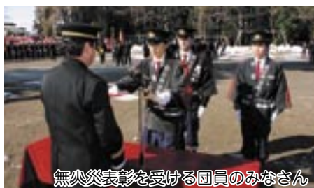
無火災表彰を受ける団員のみなさん