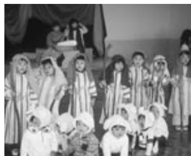
自信に満ちた子どもたち

大きな行事の一つです。子どもたちは聖書に記されている「世界ではじめのクリスマス」の話を聞き、クリスマスの意味を知ります。そして、全園児がそれぞれの役割を演じる聖誕劇を行いました。クリスマス会当日、役を演じる子どもたちの表情は自信に満ち、参加している保護者と共に子どもたちの成長を喜びました。