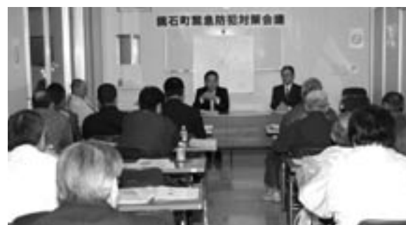
30人が出席した防犯対策会議

昨年末に福島県警が発表した県内市町村別犯罪発生率(犯罪発生件数を人口千人当たり換算)で県内ワーストとなったことを受けて、1月24日、緊急防犯対策会議を開催しました。 会議には、町防犯協会、地域安全推進協議会、防犯指導隊、地域安全活動推進員など約30人が出席、ワースト記録の汚名返上と安全・安心のまちづくりを進めることを確認しました。