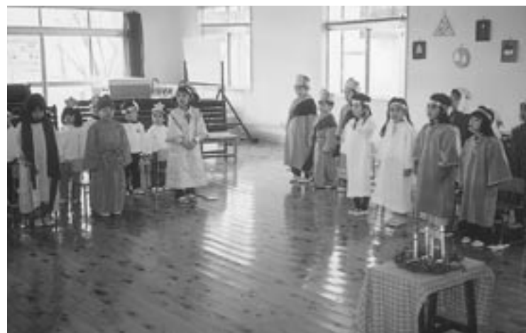
聖誕劇で賛美をします

今回のわたしたちの学校シリーズは、鏡石栄光幼稚園で昨年行われたクリスマス会の風景について紹介いたします。