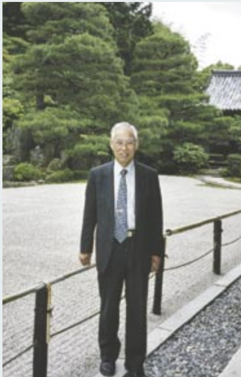
東京かがみいし会会長