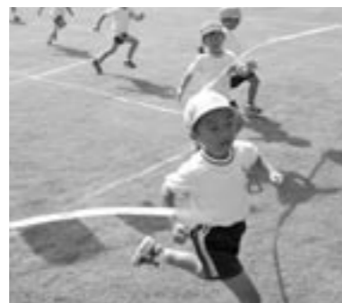
元気いっぱいグラウンドを駆け回る園児たち

鏡石幼稚園では、9月18日(日)午前9時から同園グラウンドで第34回秋季大運動会を開催しました。