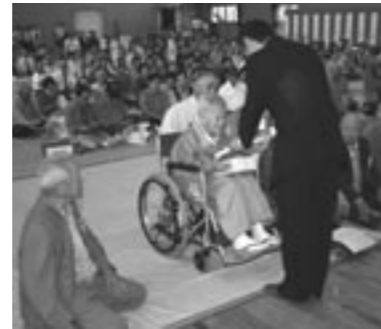
木賊町長から記念品を受けとる受賞者のみなさん

平成17年度町敬老会が、9月17日(土)午前9時30分から町鳥見山体育館で盛大に開催されました。