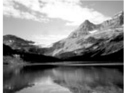
雄大なカナダの大自然

今回の中学生海外文化学習事業に参加し、いろいろな面で貴重な体験をすることができました。生徒たちとの関わり、カナダの人たちの自然との共生、英語力がなくても自分からチャレンジしていけば相手に伝わるということ。生徒たちも11日間家族と離れ一人で行動したのは初体験だったと思いますが、雄大な自然に触れたことやホームステイ体験をこれからの学習や生活に活かしてほしいと思います。保護者のみなさま、関係者のみなさまに感謝します。