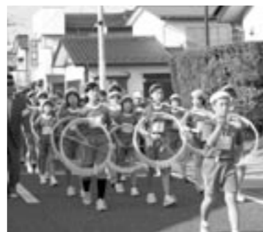
元気に演奏する児童たち

町交通対策協議会が主催する鏡石第一小学校5・6年生約250人による交通安全鼓笛隊パレードが9月25日(火)午後3時から鏡石一小校庭から鏡石駅前を一周するコースで行われました。