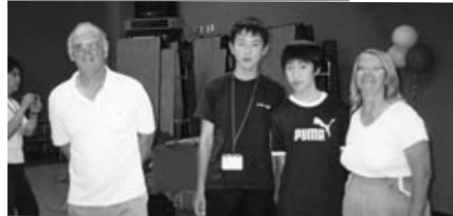
ホストファミリーとの楽しい生活