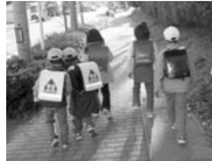
不審者には気をつけましょう

「知らない人に声をかけられた」「車に連れ込まれそうになった」など、子どもをねらった犯罪が増えています。このような、犯罪から子どもを守るためには、いざというときの心構えを普段から子どもに教えておくことが大切です。 ① いっしょに行かない 犯罪者は、親族や学校関係