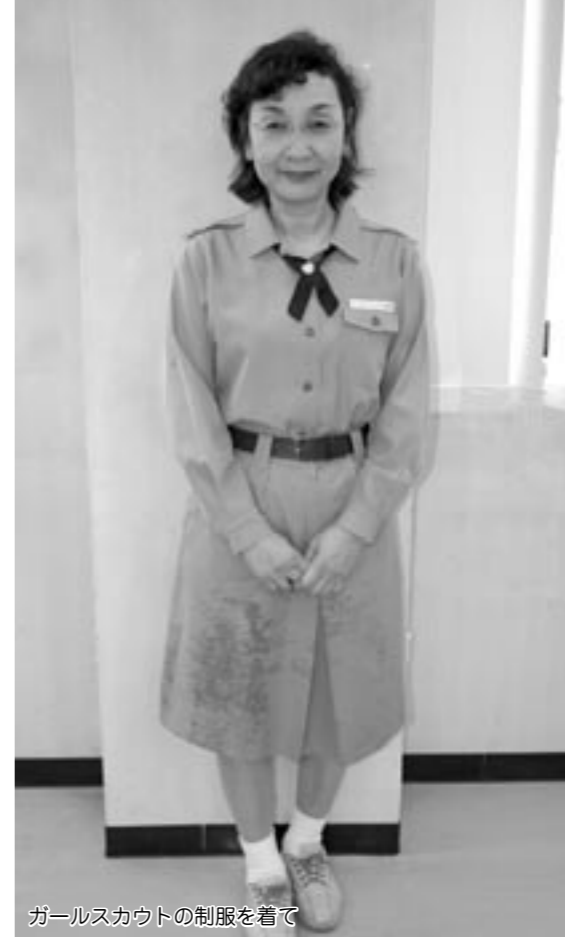
ガールスカウトの制服を着て