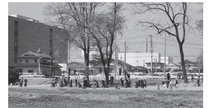
見晴らしが良くなった仮設校舎跡地

第一小学校仮設校舎解体工事が4月22日(火)に終了しました。まだ荒整地ですので子どもたちは使用できませんが、校庭が広々と見晴らしがよくなりました。校庭造成工事の開始が楽しみです。新しい校庭には、これまでのような遊具はもちろん、花壇やビオトープ、畑のスペースなども計画されています。南西の角には小さな丘を作り、起伏のあるランニングコースとして利用したり、加速体験や雪が降ればそり遊びなどもできるようになります。現在の桜などはトラックと重なりますので撤去されますが、周囲には、ほどよい木陰を作る樹木が植えられます。エコスクールとして以前のような緑豊かな環境の学校にしていきたいと思っています。