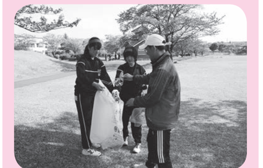
先生と生徒が一緒になって清掃に励みました