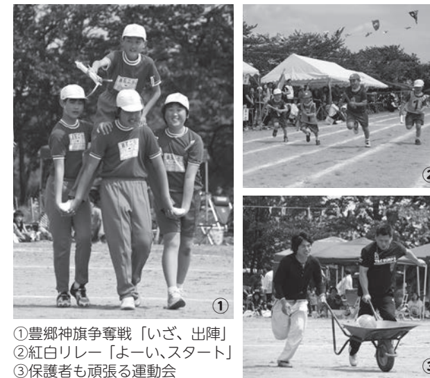
①豊郷旗争奪戦「いざ、出陣」 ②紅白リレー「よい、スタート」 ③保護者も頑張る運動会