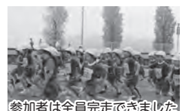
参加者は全員完走できました