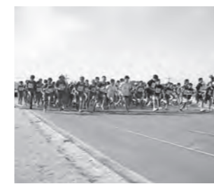
ほとんどの児童が自己ベストを更新するすばらしい走りでした

職員の駅伝チームも皆様のあたたかい声援に励まされ、昨年を上回るタイムでゴールすることができました。保護者の皆様には、登校時刻の変更や終了後のお迎え等、ご協力大変ありがとうございました。