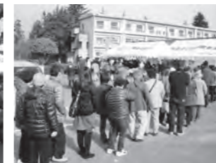
大盛況だった販売会