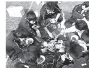
収穫物を味わう生徒たち

2つ目は11月15日(土)に本校宇津峯寮庭で初めて実施された「秋の販売会」です。シクラメンをメインに、本校で生産・加工された製品を販売しました。当日は400~500名の来客者があり大盛況でした。なお、シクラメンは現在も販売中ですので、ご購入希望の際には学校(☎62-3145)までご連絡ください。