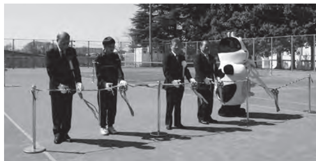
テニスコートの完成を記念してテープカット