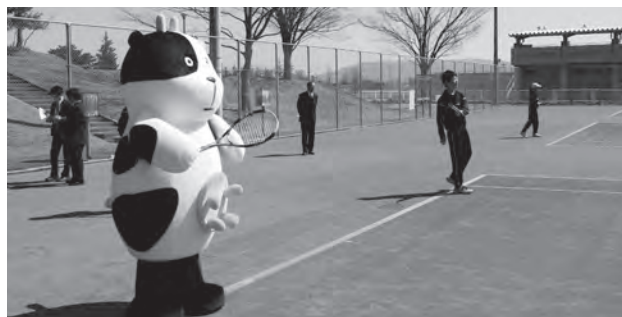
牧場のあーさー♪も鏡石中学校のみんなとテニスに挑戦

●受付・問い合わせ先 鏡石町体育施設等管理事務所(鳥見山陸上競技場内) ☎62-7636