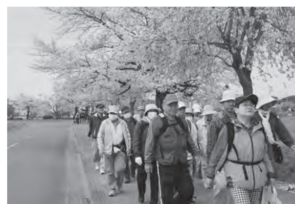
グリーンロードのさくらを眺めながら歩く参加者