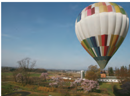
上空からみた岩瀬牧場