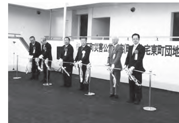
災害公営住宅の完成を祝いテープカット

式典では遠藤町長より「耐震性、居住性に優れているので、安心して生活していただきたい」とあいさつがありました。その後、来賓の方より祝辞を頂きテープカットが行われました。完成した災害公営住宅は2棟あり2DK10戸、3DK14戸の計24戸です。