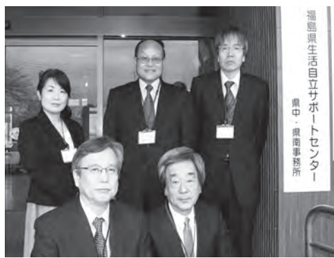
福島県生活自立サポートセンター 県中・県南事務所