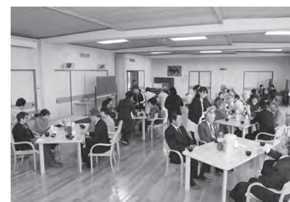
手打ちそばを美味しくいただきました

ウォーキングは、鏡石駅を出発し、グリーンロード、鳥見山公園、牧場通りの満開の桜を楽しみながら、岩瀬牧場まで往復約6キロメートルを歩きました。