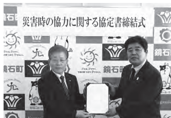
協定書締結の様子

協定書では、大規模地震及び台風等の災害発生時に、大規模な停電等が発生した場合において、緊密な連携を保ち、住民の生活と安全を確保するために電力設備の迅速かつ円滑な復旧を図るため、復旧作業に対する協力、復旧拠点の確保に対する協力、防災無線による停電周知の協力等が締結されました。