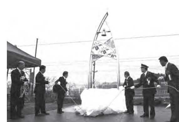
駅前広場に設置されたシンボルモニュメント

式終了後には須賀川消防署鏡石分署の指導により、規律訓練、応急処置、防水訓練が行われました。