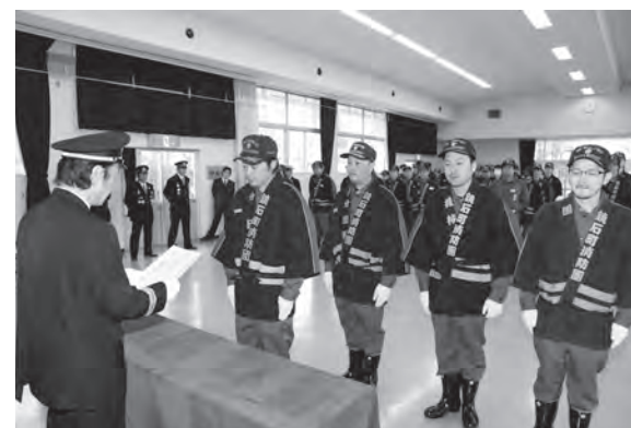
小林団長より昇格辞令を受け取る団員