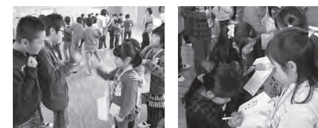
みんなで楽しくじゃんけん

1年生は楽しみながらゲームに参加し、第二小学校の一員としての思いを強くした一日でした。