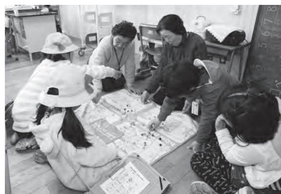
ビー玉遊び、上手にできるかな～?