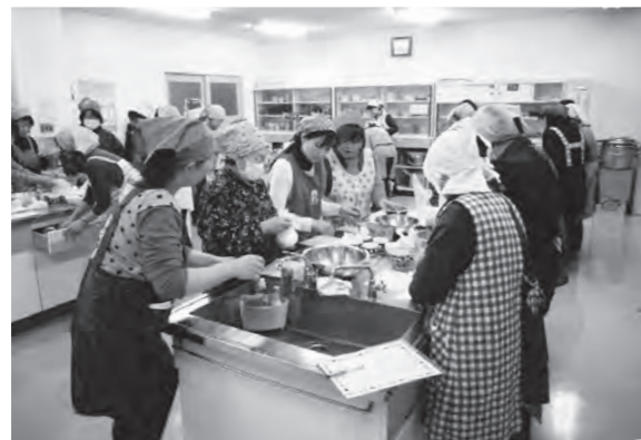
米粉のパウンドケーキ作りの様子

1月15日(金)勤労青少年ホームにおいて、ジョイフルライフ講座2015閉講式が行われ約30人が参加しました。閉講式前に最後の講座が開催され、米粉を使ったパウンドケーキのお菓子作りを行い、美味しいパウンドケーキの完成に参加者は舌鼓しました。閉講式においては、皆勤賞4人、精勤賞(一回のみ講座を休講)12人の表彰が行われ、その後一年間の活動を振り返り今年度の活動に幕を閉じました。