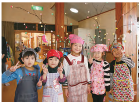
鏡石保育所だんごさし上手にできました♪