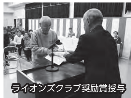
ライオンズクラブ奨励賞授与