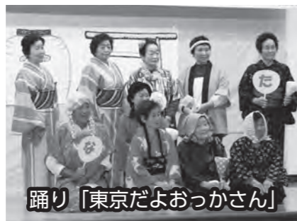
踊り「東京だよおっかさん」