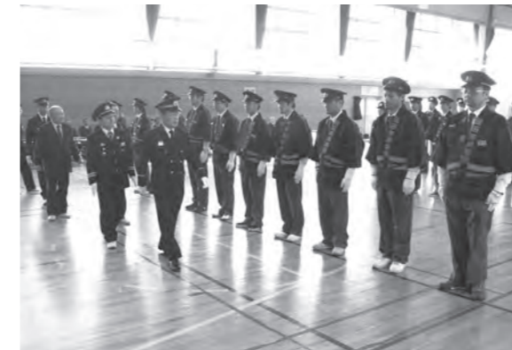
無火災・無災害の一年であることを願う団員