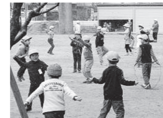
なわとび練習 (低学年)

また、2月15日(水)には、「6年生を送る会」の中で「鼓笛移杖」が予定されており、放課後の時間を使って各パートに分かれた5年生は、6年生の指導を受けて練習に取り組んでいます。