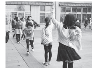
なわとび練習 (高学年)