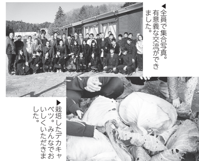
▲全員で集合写真。有意義な交流ができました。

「第4回全国農業高校生ベジコン」が12月8日(木)～12月9日(金)に福島県立会津農林高等学校で開かれました。ベジコンとは、さまざまな野菜作りに挑戦、作った野菜をみんなで一緒に食べて交流する全国的食育イベントです。今年の課題野菜はデカキャベツで、大きさを競うだけではなく、人との交流促進も競う大会です。本校は生産情報科3年生とアゴラキンダーガーデン郡山校の園児と協力して出場しました。結果はキャベツの重さ15.2kgで日本一になりました。最後は園児と共に好み焼きの試食会を開き、今回の大会は幕を閉じました。