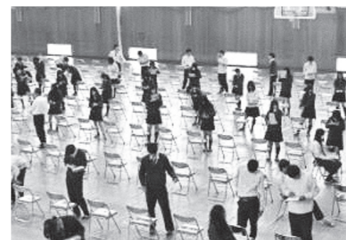
校内農業鑑定協議会の様子