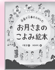
「お月さまのこよみ絵本」 理論社 千葉望：文／阿部伸二：絵

昔、日本はお月さまのこよみ（旧暦）を使って生活していました。この本は、旧暦について子どもにも理解できるように絵や例をまじえながら、わかりやすく説明しています。