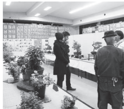
昨年の「秋の文化祭」の様子