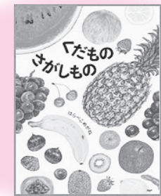
「くだもの さがしもの」 PHP 研究所 はらぺこめがね：作・絵

旧暦の説明を読むと、行事のいわれや、なぜこの季節にその行事が行われるのかなどが、とてもよくわかります。たとえば、「ひなまつり」は、現在より暖かい季節の行事でした。まさに桃の花が咲く頃の行事だったのです。巻末には旧暦で行事を楽しむカレンダーもあります。