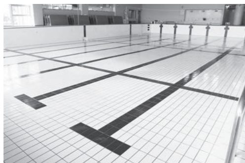
塗り替えられた「25m プール」

今回の改修で大きく変更した施設は「ろ過機」です。以前は、中空系膜ろ過方式という、フィルターで汚れを除去する方式でしたが、珪藻土ろ過方式に変更しました。この方式は、自然由来の珪藻土に汚れを吸着させる方式で、清潔でろ過精度も高く、他の多くのプールで採用されています。 また、今回の改修に併せて、25mプール内の塗装を全面塗り替えました。きれいになったプールで、皆さんのご利用をお待ちしています。