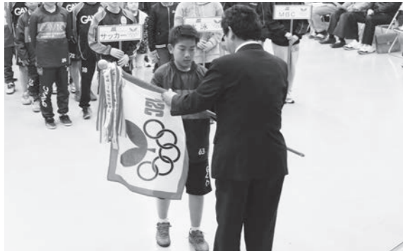
佐久間本部長から団旗を受け取る団員