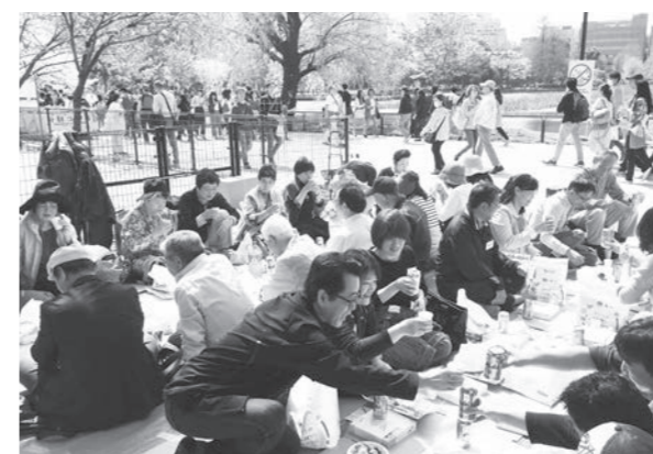
和気あいあいと交流