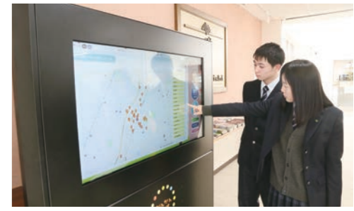
デジタルサイネージで観光情報を検索