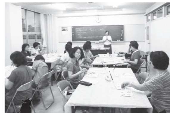
デコパージュ教室の様子