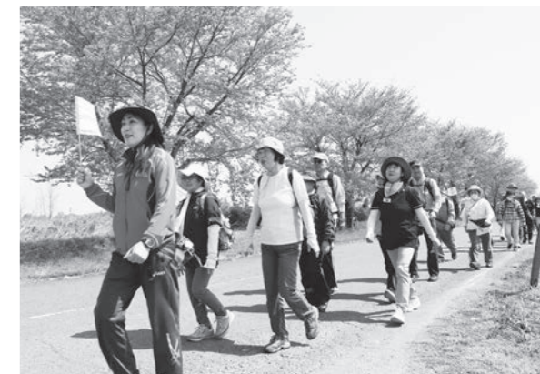
釈迦堂川沿いを歩く参加者

参加者は、釈迦堂川の桜並木やふれあいの森公園などを巡り、春の陽気の中でのウォーキングを楽しみました。終了後には抽選会が行われ、トップバリュー商品の詰め合わせや田んぼアート米、岩瀬牧場のヨーグルトなどが贈られました。