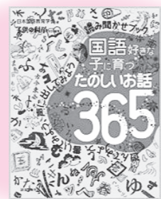
「国語好きな子に育つたのしいお話 365」 誠文堂新光社 日本国語教育学会：著

盲導犬を見たことはありますか？この絵本は、視覚障がい者と、盲導犬について、子どもにも理解できるように描かれています。この本の主人公メグは、少しずつ視力を失う病気を患い、盲導犬のユーザーとなることになりました。ユーザーと盲導犬と一緒に訓練する様子や、盲導犬の仕事ぶり、盲導犬を連れて視覚障がい者を街で見かけた際の注意点や声のかけ方などを学ぶことができます。親子で一緒に読みたい絵本です。