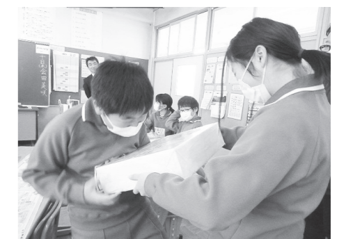
「うわっ、重〜い」 1万円札が1億円分！

この学習を契機として、将来の納税者（現在も消費税には関係していますが）としてその意義を理解し、義務を果たす大人になっていくことを期待しています。