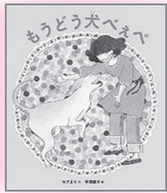
「もうどう犬ベェベ」 ほるぷ出版 セアまり：文 平澤明子：絵

盲導犬を見たことはありますか？この絵本は、視覚障がい者と、盲導犬について、子どもにも理解できるように描かれています。この本の主人公メグは、少しずつ視力を失う病気を患い、盲導犬のユーザーとなることになりました。ユーザーと盲導犬と一緒に訓練する様子や、盲導犬の仕事ぶり、盲導犬を連れて視覚障がい者を街で見かけた際の注意点や声のかけ方などを学ぶことができます。親子で一緒に読みたい絵本です。