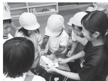
鏡石幼稚園の園児たちと楽しい時間を過ごしました！

7月11日(木)、17日(木)技術・家庭科の「幼児のふれあい」の授業で、鏡石幼稚園に授業で作ったおもちゃを持参し、ふれあい体験をしてきました。一緒に砂遊びをしたり、サッカーゲームをしたり、かけっこしたりするなど、幼児の遊びの役割や心身の発達を学習し、有意義な時間を過ごしました。