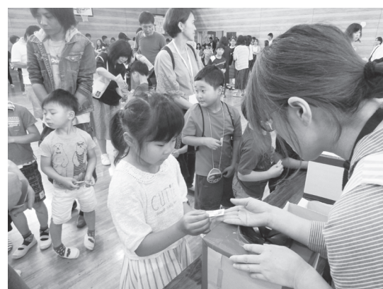
多くの人で賑わった「まきばっこ祭」