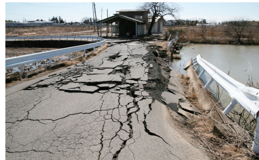
決壊寸前だった蒲之沢池（平成23年3月12日撮影）

9月1日は「防災の日」。大正12年のこの日に発生した「関東大震災」を教訓に、防災を見直すために定められた日です。この震災の記憶が遠ざかってきた平成7年1月に阪神・淡路大震災が、また、平成23年3月11日には鏡石町でも震度6強を観測した東日本大震災が発生し、私たちは震災の恐ろしさを改めて思い知らされました。いざという時、大切な命や財産を地震から守るためには、日ごろの危機管理が大切です。ここでは、地震などの災害が起きた場合の行動についてお知らせします。