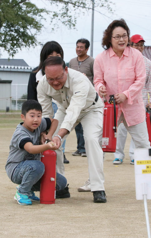
昨年9月に行われた初期消火訓練の様子