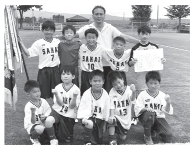
フットサルで優勝したさかい