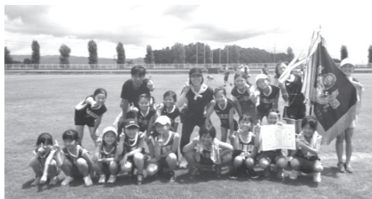
ドッジボールで優勝した三区B