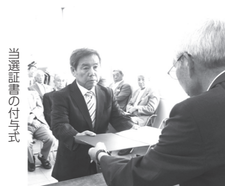
当選証書の付与式

今回の選挙の当日有権者数は10,343人で、議会議員一般選挙は即日開票され、有効投票数5,793票(無効100票)が投じられました。投票率は56・98%でした。選挙翌日には当選証書付与式が行われ、当選者に当選証書が手渡されました。