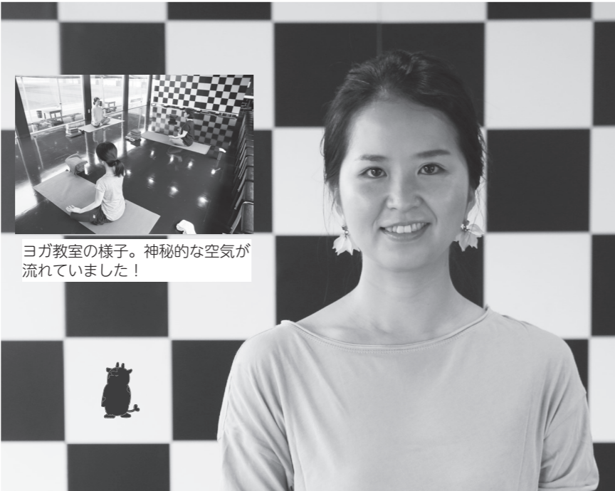
ヨガ教室の様子。神秘的な空気が流れていました！